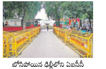
బోసపాయిస్ ఢిల్లీలోని దివసానీ కార్యాలయం

న్యూఢిల్లీ, డిసెంబర్ 3: తాజా అసెంబ్లీ ఎన్నికల ఫలితాల నేపథ్యంలో దేశవ్యాప్తంగా కాంగ్రెస్ పాలిత రాష్ట్రాల సంఖ్య మూడుకు తగ్గింది. ప్రస్తుత ఎన్నికల్లో ఆ పార్టీ రాజస్థాన్, ఛత్తీస్ గఢ్ లో అధికారం కోల్పోయింది. తెలంగాణలో కొత్తగా అధికారంలోకి వచ్చింది. ప్రస్తుతం ఆ పార్టీ కర్ణాటక, హిమాచల్, తెలంగాణలో మాత్రమే అధికారం చేపడుతున్నది. ఇక మధ్యప్రదేశ్ లో అధికారం నిలుపుకోవడం తోపాటు రాజస్థాన్, ఛత్తీస్ గఢ్ ను కూడా బీజేపీ తాజాగా తన అధికారం చేసుకున్నది. దీంతో దేశంలో బీజేపీ అధికారంలో ఉన్న రాష్ట్రాల సంఖ్య 12కు పెరిగింది. ప్రస్తుతం గెలుపొందిన మూడు రాష్ట్రాలతోపాటు ఉత్తరాధిపత్యం, హర్యానా, ఉత్తరప్రదేశ్, గుజరాత్, గోవా, ఆస్సాం, త్రిపుర, మణిపూర్, అరుణాచల్ ప్రదేశ్ లో ఆ పార్టీ సొంతంగా అధికారంలో ఉన్నది.