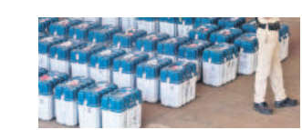
నెడు మిజోరం తీర్పు ఓట్ల లెక్కింపును కర్నాటక పూర్తి

మహారాష్ట్ర, మేఘాలయ, నాగాలాండ్, సిక్కిం రాష్ట్రాల్లో ఏర్పాటైన సంకీర్ణ ప్రభుత్వాలలో ఆ పార్టీ భాగస్వామిగా ఉన్నది. బీహార్, జార్ఖండ్, తమిళనాడు సంకీర్ణ ప్రభుత్వాలలో కాంగ్రెస్ భాగస్వామ్య పక్షంగా కొనసాగుతున్నది. 'నాలుగు రాష్ట్రాల అసెంబ్లీ ఫలితాల తర్వాత, ఉత్తరాధిపత్యం అధికారం చేపడుతున్నది. ఇక రృపింది' అని అవే నాయకుడు జాన్సన్ షా 'ఎక్స్ ప్రెస్'లో సందేశాన్ని పోస్ట్ చేశారు. ప్రస్తుతం బీజేపీ, కాంగ్రెస్, బీఎస్ పీ, సీపీఎం, ఎన్ డీపీ, ఆఐ.. ఆరు పార్టీలు జాతీయ పార్టీ హోదాను కలిగి ఉన్నాయి. సిక్కిం, అరుణాచల్ ప్రదేశ్, ఒడిషా, ఉత్తరప్రదేశ్ రాష్ట్రాల అసెంబ్లీ ఎన్నికలు 2024లో జరగనున్నాయి. సాంకేతిక ఎన్నికలతో కలిపి బీజేపీ ఎన్నికలు నిర్వహించనున్నారు.