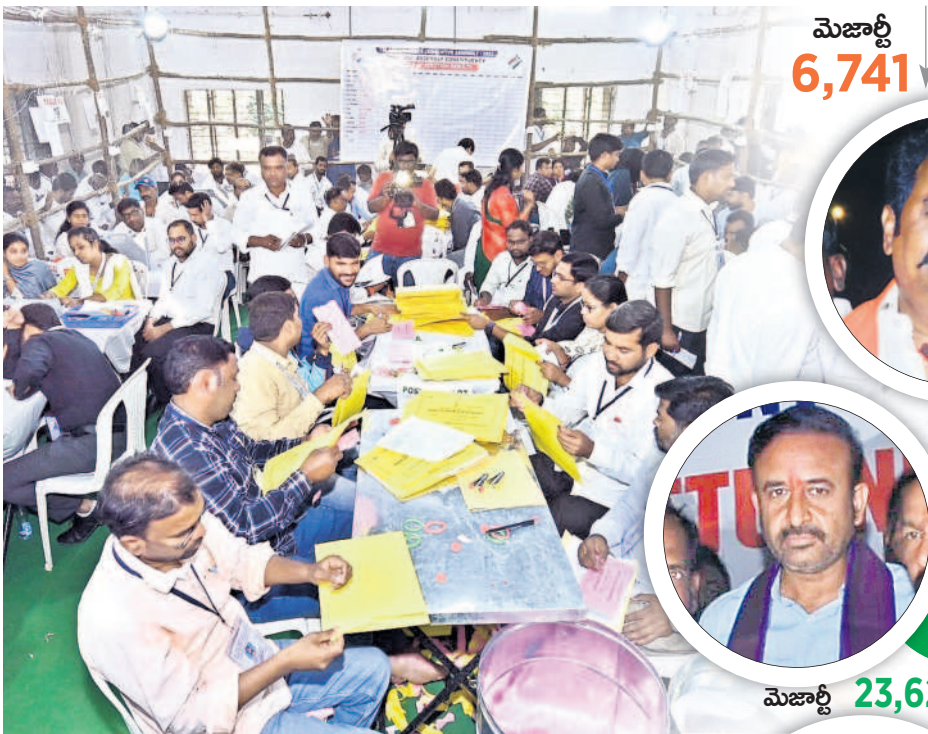
నిజామాబాద్ లో పోస్టల్ బ్యాలెట్ లెక్కింపులో నిమగ్నమైన ఎన్నికల సిబ్బంది