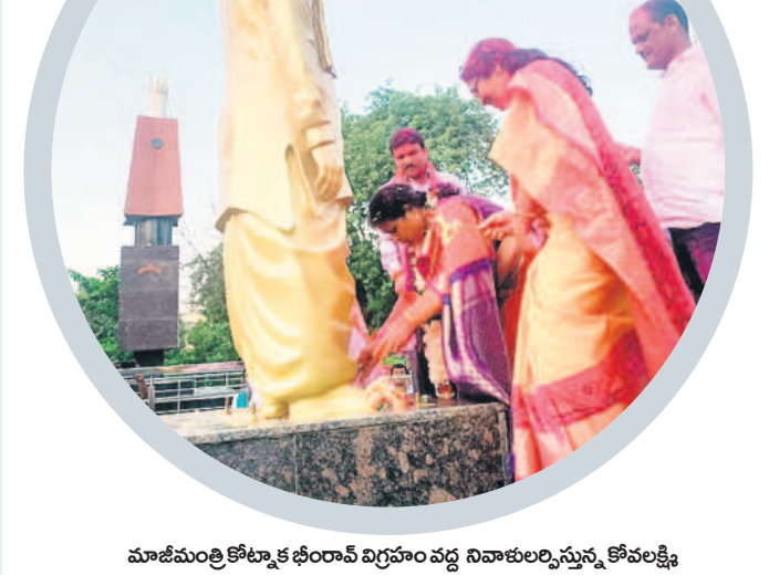
మాజీ మంత్రి కొట్లూక భీరంపాల్ విగ్రహం వద్ద నివాళులర్పిస్తున్న కోవ లక్ష్మి