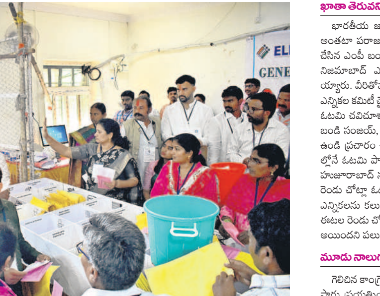
కరీంనగర్ ఎస్సారీ కళాశాలలో ఓట్లను లెక్కిస్తున్న సిబ్బంది