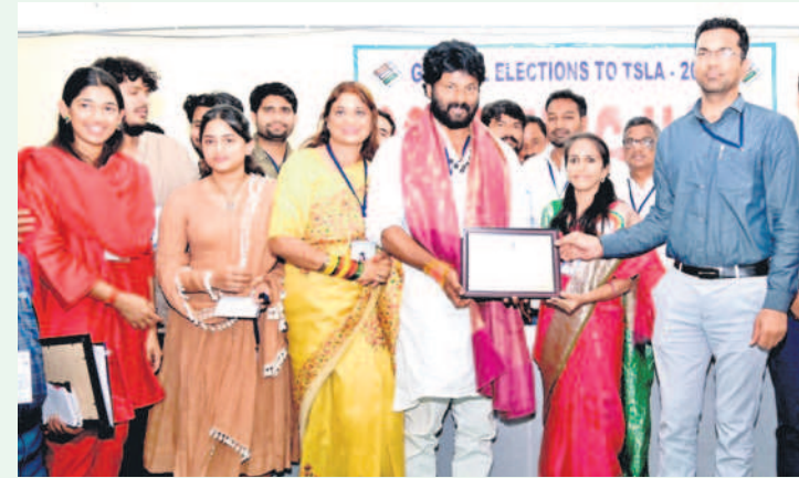
రామగుండం : ఎన్నికల అధికారి నుంచి ధ్రువీకరణ పత్రం అందుకుంటున్న రాజేలాకూర్ మక్కాసీనింగ్