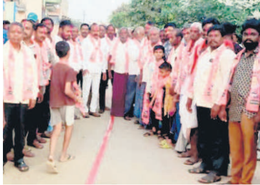
పటాకులు కాలుతున్న కరీంనగర్ రూరల్ మండలంలోని ప్రజాప్రతినిధులు, కార్యకర్తలు