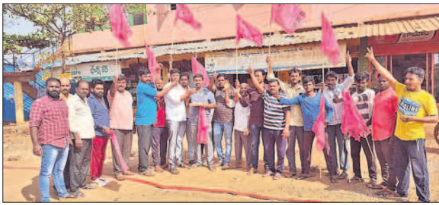
కోహార్లో మిరాయిలను తినిపించుకుంటున్న బీఆర్ఎస్ నాయకులు