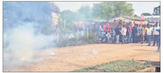
కోహార్లో పటాకులు కాలుస్తున్న బీఆర్ఎస్ శ్రేణులు