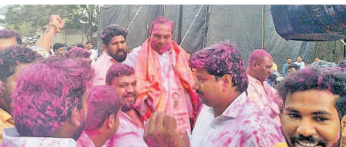
ఎమ్మెల్యేగా మాణిక్రావు గెలుపొందడంతో సంబురాలు జరుపుకుంటున్న నాయకులు