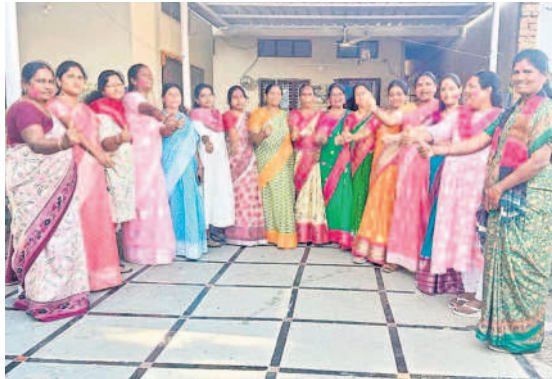
బచ్చన్నపేటలో సంబురాలు చేస్తున్న జాగృతి మహిళా నాయకులు