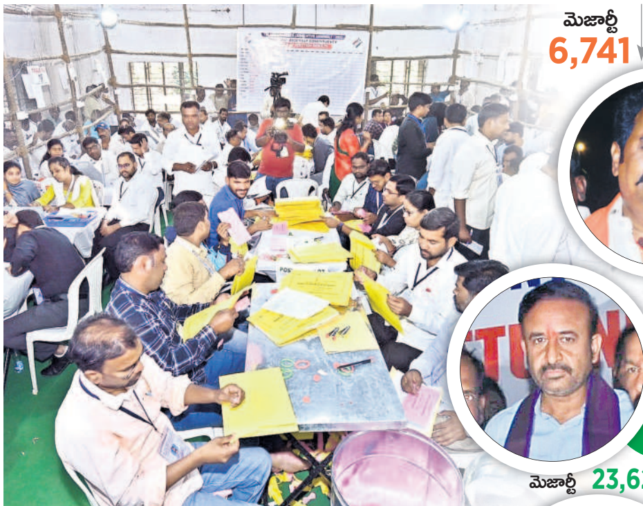
నిజామాబాద్ లో పోస్టల్ బ్యాలెట్ల లెక్కింపులో నిమగ్నమైన ఎన్నికల సిబ్బంది