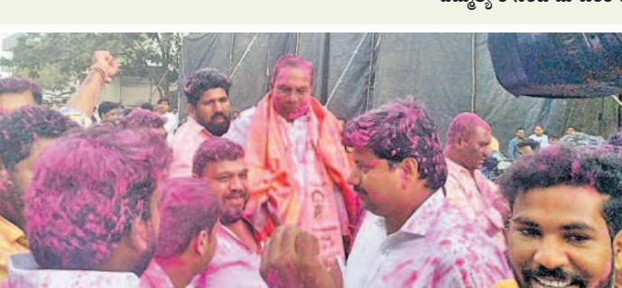
ఎమ్మెల్యేగా మాణిక్రావు గెలుపొందడంతో సంబురాలు జరుపుకుంటున్న నాయకులు