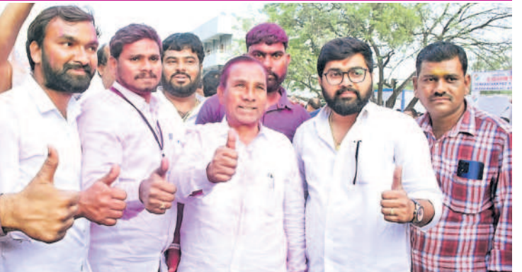
విజయ సంతోషం చూపుతున్న జమీరాబాద్ ఎమ్మెల్యే మాణిక్ రావు