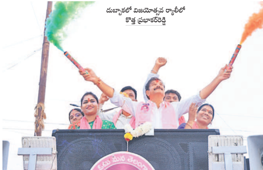
దుబ్బాకలో విజయోత్సవం రా్యలీలో కొత్త ప్రభాకర్ రెడ్డి