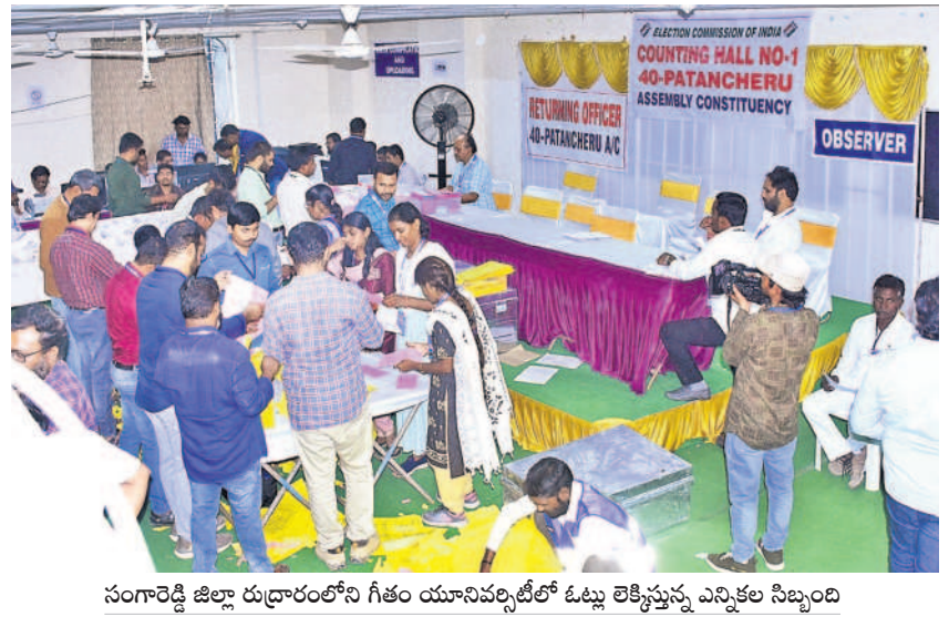
సంగారెడ్డి జిల్లా రుద్రాచలంలోని గేతం యూనివర్సిటీలో ఓట్ల లెక్కింపును ఎన్నికల సిబ్బంది