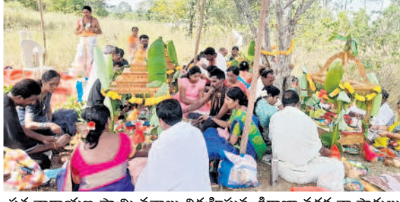
సత్యనారాయణ స్వామి వ్రతాలు నిర్వహిస్తున్న కిరాణా వర్తక వ్యాపారులు