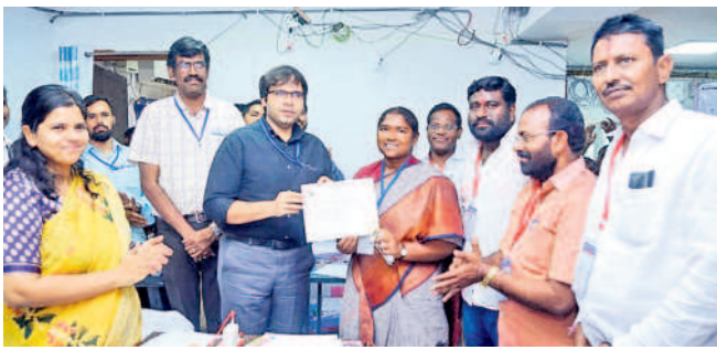
ఎమ్మెల్యేగా గెలుపొంది ములుగు కలెక్టర్ ఇలా త్రిపాలి, రిటర్నింగ్ అధికారి అంకిత్ నుంచి ధ్రువీకరణ పత్రాన్ని అందుకుంటున్న సీతక్క