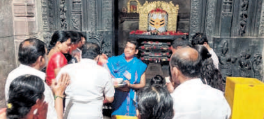
వెంకటాపూర్ : రామప్పలో పూజలు చేస్తున్న భక్తులు

మంగపేట : మండలంలోని మల్లూరు హేమాచల లక్ష్మీనర్సింహస్వామి దేవస్థానంలో ఆదివారం ఆయా ప్రాంతాల భక్తులు ప్రత్యేక పూజలు నిర్వహించారు. ఉదయాన్నే ఆలయ అర్చకులు స్వామివారికి తిలతైలాభిషేక క్రతువు నిర్వహించి ప్రత్యేకంగా అలంకరించారు. ఈ సందర్భంగా పలు ప్రాంతాల నుంచి గుట్టకు వచ్చిన భక్తులు స్వామివారిని దర్శించుకున్నారు. అర్చకులు భక్తులకు ఆశీర్వాదాలు అందించారు. దైవ దర్శనానికి ముందు భక్తులు చింతామణి జలపాతాన్ని సందర్శించారు.