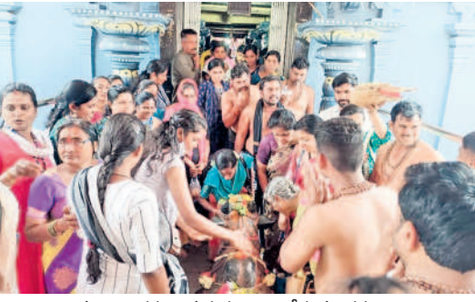
నంది విగ్రహం వద్ద పూజలు చేస్తున్న భక్తులు కాళేశ్వరంలో భక్తుల సందడి

కాళేశ్వరం : శ్రీకాళేశ్వర ముక్తేశ్వర స్వామి వారి ఆలయంలో కార్తీక మాసం మూడో ఆదివారం సందర్భంగా భక్తులు సందడి చేశారు. ఇతర రాష్ట్రాల, వివిధ జిల్లాల నుంచి అనేక మంది తరలి వచ్చారు. తెల్లవారు జామునుంచే భక్తులు తివేణి సంగమం గోదావరి తీరంలో స్నానాలాచరించారు. మహిళలు దీపాలు వదిలి, నైకత లింగాలకు పూజలు చేశారు. అనంతరం ఆలయంలో స్నామివారిని దర్శించుకున్నారు. ఆలయంలోని తులసి, మారేడు చెట్టు వద్ద భక్తులు లక్ష వత్తులు, కార్తీక దీపాలు వెలిగించారు. వివిధ పూజల ద్వారా 2.32 లక్షల వరకు ఆదాయం వచ్చినట్లు అధికారులు తెలిపారు.