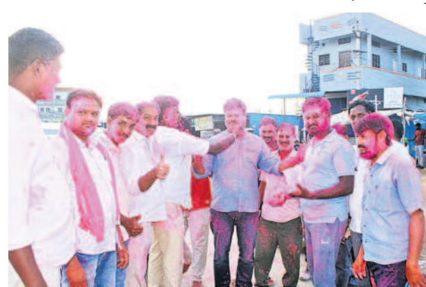
పల్లె గెలుపుతో పెంబిల్ వద్ద సంబురాలు చేసుకుంటున్న బీఆర్ఎస్ శ్రేణులు