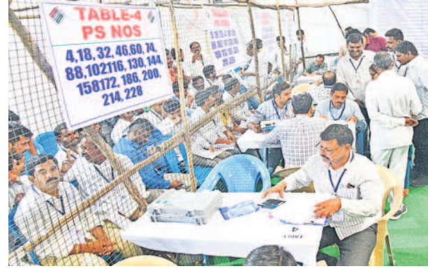
ఎనుమామల కొంటింగ్ సెంటర్లో..