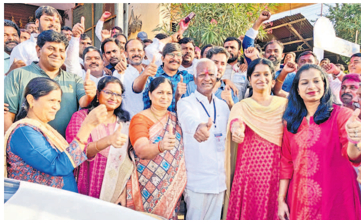
కుటుంబసభ్యులు, బీఆర్ఎస్ శ్రేణులతో కలిసి విజయ సంతోకం చూపుతున్న స్టేషన్ ఘనపూర్ బీఆర్ఎస్ ఎమ్మెల్యే కడియం శ్రీహరి