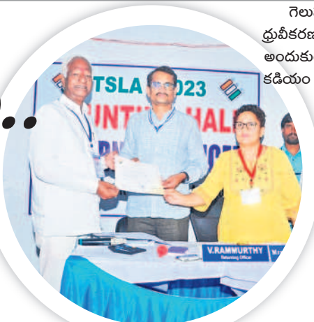
గెలుపు ధ్రువీకరణ వత్తం అందుకుంటున్న కడియం శ్రీహరి