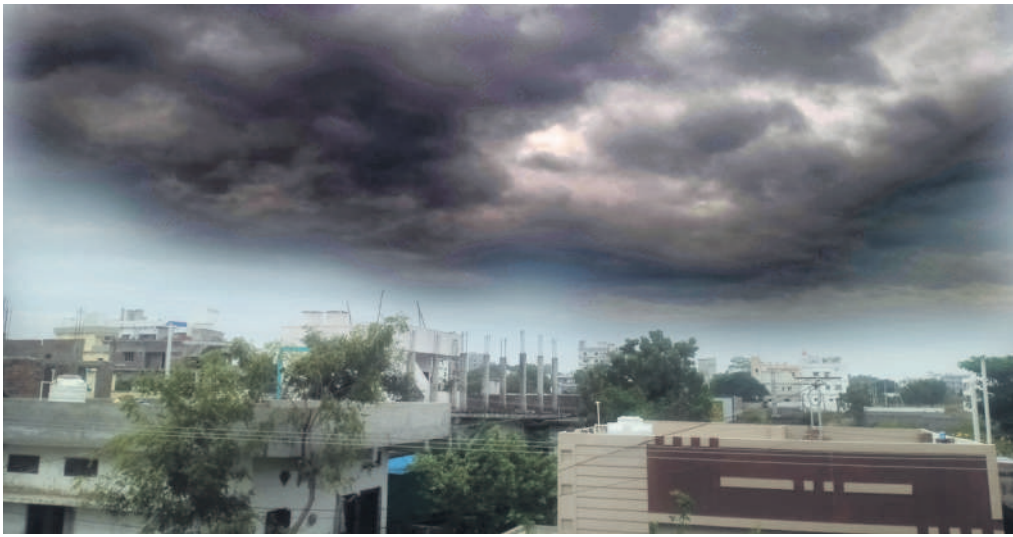
ఖమ్మం రూరల్ మండలంలో అలుముకున్న దట్టమైన మేపూలు