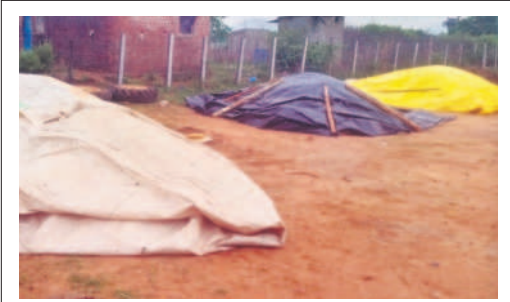
భద్రాద్రి కొత్తగూడెం: దాన్యం రాసులపై టార్పాలిన్ కప్పిన రైతులు