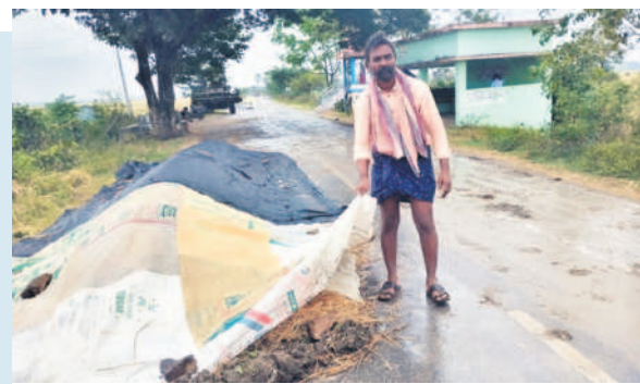
దాచాపురం గ్రామంలో వడ్లు తడవకుండా పట్టాలు కప్పాతున్న రైతు

భద్రాద్రి కొత్తగూడెం, డిసెంబర్ 4 (నమస్తే తెలంగాణ)/ఖమ్మం వ్యవసాయం: నైరుతి బంగాళాఖాతంలో ఏర్పడిన అల్పమేడనంతో ఉమ్మడి జిల్లాలో వాతావరణంలో మార్పులు కనిపించాయి. మిచౌంగ్ తుపాన్ ప్రభావం సోమవారం సుస్పష్టంగా రెండు జిల్లాల్లో స్పష్టంగా కనిపించింది. ఉదయం నుంచి సాయంత్రం వరకు దట్టమైన మేపూలు అలుముకోవడంతో ఏకటి వాతావరణం కనిపించింది. ప్రధాన రవాణాదారులపై వాహనదారులు లైట్లు వేసుకోని ప్రయాణం సాగించిన దృశ్యాలు కనిపించాయి. చలి వాతావరణం కొనసాగి కొన్నిచోట్ల చిరుజల్లులు కురిశాయి. ఆకాశం మేఘావృతం కావడంతో నగర వ్యవసాయ మార్కెట్లకు మిర్చి, పత్తి పంటను తీసుకువచ్చిన రైతులు తొలుత ఆందోళన చెందుకున్నారు. మధ్యాహ్నంలోపు క్రయవిక్రయాలు, కాంటాల ప్రక్రియ ముగియడంతో ఇటు రైతులు, ఇటు మార్కెట్ అధికారులు ఊపిరి పీల్చుకున్నారు. తుపాన్ మంగళవారం నాటికి ఏపీలోని మచిలీ పట్నం- నెల్లూరు మధ్య తీరం దాటే అవకాశం ఉందని జిల్లా వ్యవసాయశాఖ అధికారులు, వైరా కృషి విజ్ఞానకేంద్ర శాస్త్రవేత్తలు వెల్లడించారు. ఈలోపు రెండు జిల్లాల్లోనూ మోస్తరు నుంచి భారీ