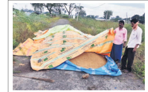
కూసుమంచిలో తుపాన్ ప్రభావంతో..