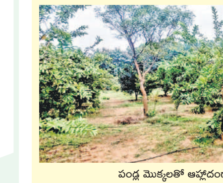
పండ్ల మొక్కలతో ఆహ్లాదంగా వనం

ఒకప్పుడు ఆది చిట్టడవిని తలపించే రక్షకభట నిలయం. ఎటు చూసినా పిచ్చిమొక్కలతో నిండిన అవరణం. ఆసలే పోలీస్ స్టేషన్. ఆపై ఆడవిని తలపిస్తుంటూ అందులోకి వెళ్లాలంటే భయంగానే ఉండేది. అదే పోలీస్ స్టేషన్, అందులోనే ఏసీబీ కార్యాలయం, సిబ్బంది కార్యాలయం, ఎమ్మెల్యే నిర్మించిన ఆ భవనాలు శిథిలంకావడంతో ఉండగా.. దాదాపు 8 ఏకరాల స్థలం నియమంగా ఉండేది. ఆ పరిసరాలన్నీ పిచ్చిమొక్కలతో, గడ్డిమొలిన విషపూరిత తీటకాలతో అవాసంగా మారాయి. నాటి కల్యాణు ఏసీబీ వెంటకేళ్లే, నాటి సీనియర్ రమాకాంత్ బాధ్యతలు చేపట్టిన తర్వాత.. ఆ ఖాళీ స్థలానికి మహర్షుల పట్టుకుంది.