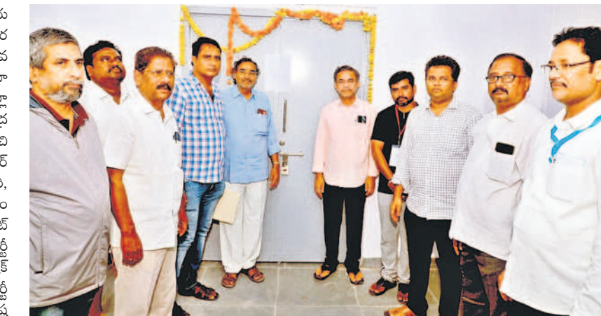
ఈవీఎంలను భద్రపరిచిన గదికి కాళాలు వేసిన అధికారులు