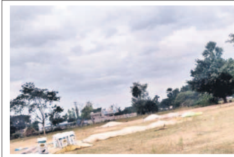
మోరంపల్లిబంజర్లో ధాన్యం రాసులపై పరదాలు కప్పిన రైతులు