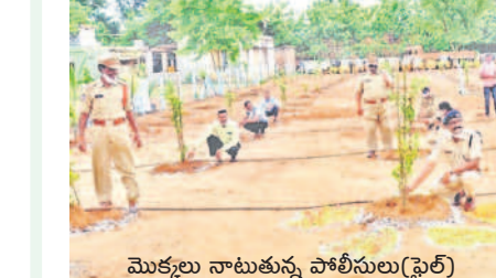
మొక్కలు నాలుగునూ పోలీసులు (పైలే)

నరుద్దెనా.. వానరుద్దెనా ఆకలి కామన్. మరి అడవుల్లో ఆహారం దొరక్క జనజీవనంలో భాగమవుతున్న వానరాల పరిస్థితి ఏంటి? వాటి ఆకలి ఎలా తీరాలి? అందుకే తెలంగాణ పోలీస్ శాఖ వినియోగం ఆలోచించింది. 2020లో సత్సపత్తి పోలీస్ స్టేషన్ వకన్ వేసిన 'వానర వనం' ఏర్పాటు చేసింది. రెండేకరాల విస్తీర్ణంలో 270 రకాల పండ్ల మొక్కలతో ప్రస్తుతం ఈ వనం ఆహ్లాదకరంగా కనిపిస్తున్నది. - సత్సపత్తి, డిసెంబర్ 4