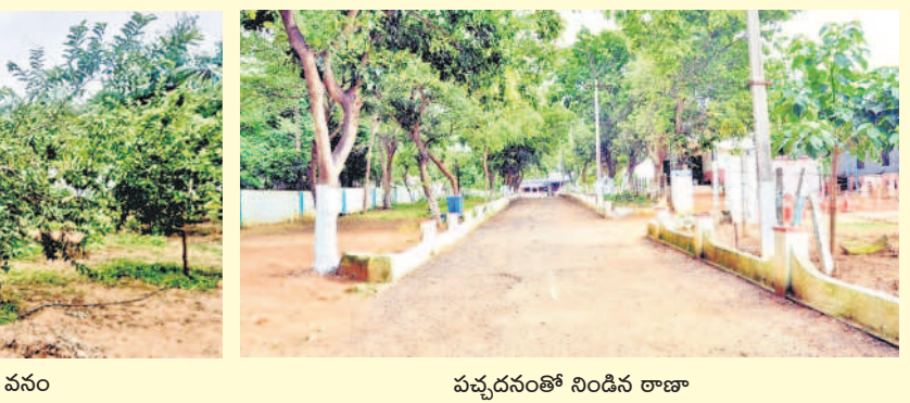
పచ్చదనంతో నిండిన రాణా

ఒకప్పుడు పోలీస్ స్టేషన్ కు వన్నె ఎటుచూసినా శిథిలమైన వాహనాలు, చెత్తాచెదారంతో నిండి ఉండేది. నేడు ఆ వాహనాలన్నీ ఓ క్రమవద్దతీర్చి పేర్చారు. పోలీస్ స్టేషన్ లో ఆడుగుపెట్టగానే ఉద్యానవనాన్ని తలపించేలా ఏర్పాటు పెరిగిన చెట్లు స్వాగతం పలుకుతున్నాయి. లోనికి ప్రవేశించగానే వివిధ రకాల పండ్లు, పూల మొక్కలతో స్టేషన్ అవరణంకా ఆహ్లాదకరంగా మారిపోయింది.