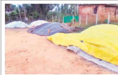
భద్రాద్రి కొత్తగూడెం: దాన్యం రాసులపై టార్పాలిన్ కప్పిన రైతులు

ప్రస్తుతం రెండు జిల్లాల్లో చలి కోత, మిర్చి తీత పనులు జోరుగా సాగు తున్నాయి. తుపాన్ కారణంగా చెదర మదురు వర్షాలు కురిసే అవకాశం ఉన్నందున రైతులు అప్రమత్తంగా ఉండాలని వ్యవసాయశాఖ అధికారులు సూచిస్తున్నారు. గంటకు 40-50 కి.మీ వేగంతో ఈదురుగాలులు వీచే అవకాశం ఉందంటున్నారు. తుపాన్ భయంతో రైతులు ఇప్పటికే కల్లాల్లో ధాన్యంపై పట్టాలు కప్పి ఉంచారు. రైతులు వ్యవసాయానికి సంబంధించిన అన్ని పనులను తాత్కాలికంగా వాయిదా వేసుకోవాలని సూచించారు. తోటల్లో నీకందిన మిర్చి పంటను సురక్షిత ప్రాంతాలకు తరలించి దానిపై టార్పాలిన్లు కప్పాలంటున్నారు. ఉరుములు, మెరుపులు వచ్చే సమయంలో ప్రజలెవరూ చెట్ల కింద నిలబడద్దన్నారు. జీవాలనూ చెట్ల కింద ఉంచడంవద్దు.