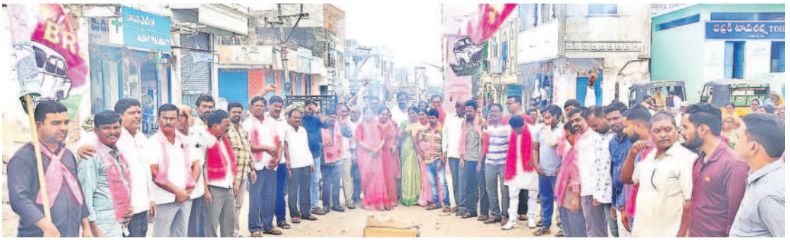
గంజిరావుపేట: మండల కేంద్రంలోని అమరవీరుల స్తూపం వద్ద గులాబుల చేస్తున్న జి.ఎస్.ఎస్. నేతలు

నాడు కేవలం ఒకే ఒక్క ప్రభుత్వ డిగ్రీ కళాశాలకే పరిమితమైన సిరిసిల్ల నేడు ఎదుక్కేవన్నీ హాబీ ఏర్పడింది. మెడికల్, వస్తపనాయ యూనివర్సిటీ,