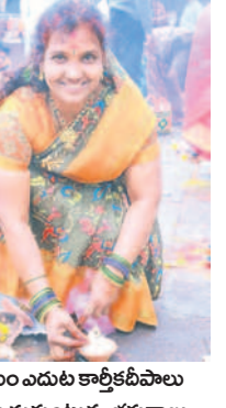
ఆలయం ఎదుట కార్మికుల పాటలు వెలిగించుకుంటున్న భక్తులు