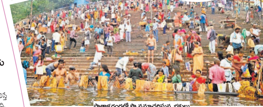
పాతాళ గంగలో స్నానమాచరిస్తున్న భక్తులు