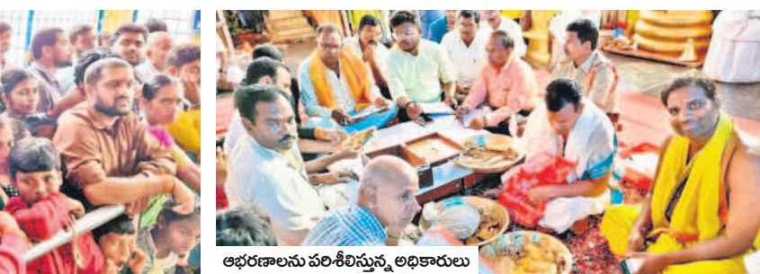
ఆభరణాలను పరిశీలిస్తున్న అధికారులు