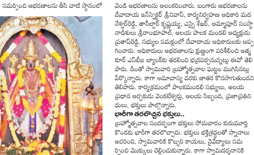
కాంచనగుహలో కొలువైన కురుమూర్తిస్వామి మూలవిరాట్

■ స్వామివారి ఆభరణాలను అధికారులకు అప్పగించిన అర్చకులు ■ అత్తకూర్ ఎన్ బిబిలో భద్రవచ్చిన ఆలయ అధికారి