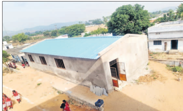
రుద్రంగి మండల కేంద్రంలో చివరి దశకు చేరుకున్న భోజనశాల నిర్మాణ పనులు

● త్వరలో అందుబాటులోకి.. ● విద్యార్థులకు తొలగనున్న ఇబ్బందులు