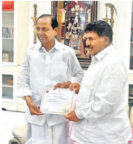
కేసీఆర్ తో ఖైరతాబాద్ ఎమ్మెల్యే దానం నాగేందర్, జూబ్లీహిల్స్ ఎమ్మెల్యే మాగంటి గోపీనాథ్, అంబర్ పేట ఎమ్మెల్యే కాలేరు వెంకటేశ్, ముషీరాబాద్ ఎమ్మెల్యే మురా గోపాల్