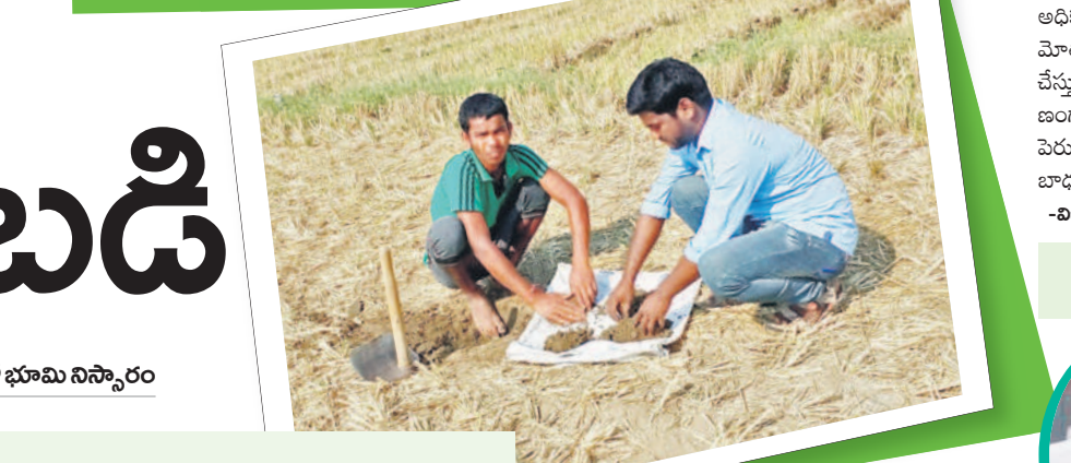
మెదక్లో భూసార పరిరక్షణ నిర్వహిస్తున్న వ్యవసాయ అధికారులు (డైరీ)