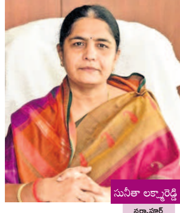
సునితా లక్ష్మి సర్కార్