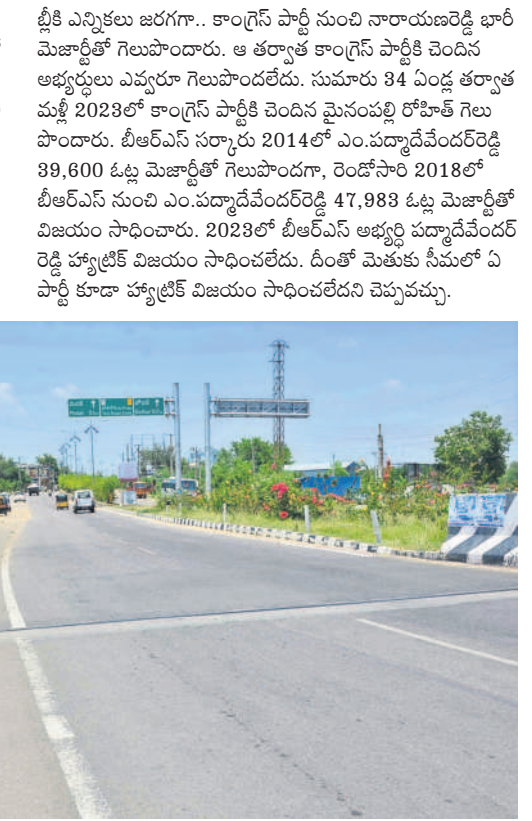
నేల పరిరక్షణ అందరి బాధ్యత