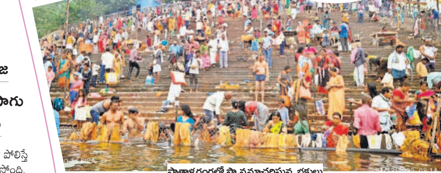
పాతాళ గంగలో స్నానమాచరిస్తున్న భక్తులు