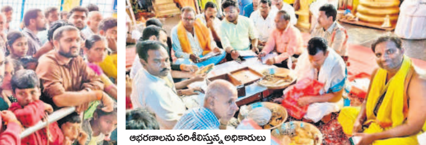
ఆభరణాలను పరిశీలిస్తున్న అధికారులు