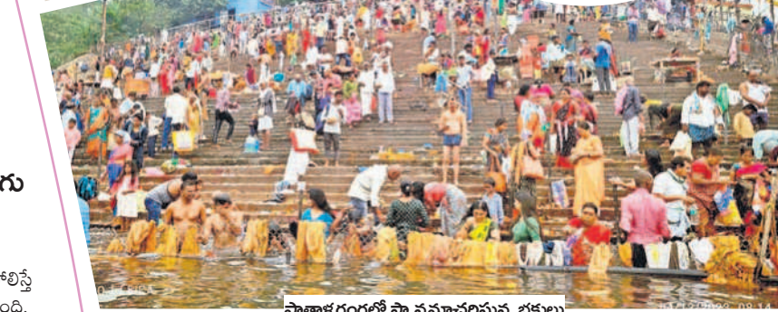
పాతాళ గంగలో స్నానమాచరిస్తున్న భక్తులు