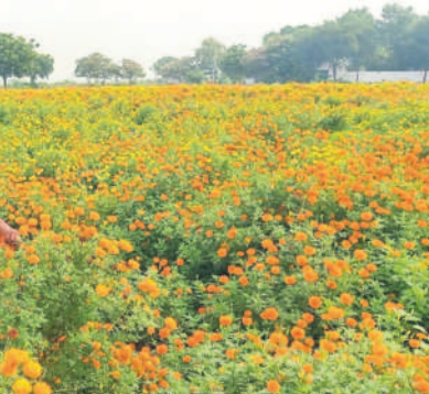
లకు 6 వేలు ఖర్చు అయ్యింది. రెండుసార్లు ఎరువులు వేయడంతోపాటు మందులు పిచి తీసుకొని 12 వేల బంతి మొక్కలు(పసుపు, ఎరుపు రంగు) నాటాడు. ఆంధ్రాలోని మాచర్ల నర్సరీలో ఒక్కో మొక్కను 5 రూపాయల చొప్పున కొనుగోలు చేశాడు. మొక్కలకు మండల కేంద్రంలో ఎకరం నల్లరేగడి భూమిని కారుకు రూ.20 వేల చొప్పున కొలుకు తీసుకొని 12 వేల బంతి మొక్కలు(పసుపు, ఎరుపు రంగు) నాటాడు. ఆంధ్రాలోని మాచర్ల నర్సరీలో ఒక్కో మొక్కను 5 రూపాయల చొప్పున కొనుగోలు చేశాడు. మొక్కలకు

దిగుబడి ప్రారంభమైంది. రోజుకు 50 నుంచి 100 కేజీల వరకు మార్కెట్లో అమ్ముతున్నారు. తోట హైవే పక్కనే ఉండడంతో ఎంతోమంది తోట వద్దకే వచ్చి పూలు కొనుగోలు చేస్తున్నారు. పరిసర ప్రాంతాల నుంచి పూలవ్యాపారులతో పాటు అయ్యప్ప భక్తులు అధికంగా కొను గోలు చేస్తున్నారు. ఇటీవల ఎలక్షన్ కూడా ఉండడంతో మంచి గిరాకీ వచ్చింది. 90 వేలు పెట్టుబడి పెట్టి పూలసాగు చేపట్టగా ఇప్పటి వరకు అన్ని ఖర్చులు పాసు లక్ష రూపాయలు మిగిలినట్లు రైతు తెలి పాడు. ఈ వంట 180 రోజులపాటు దిగుబడి వస్తుందని, సంత్రాతి వరకు కొనసాగుతుందని చెప్పాడు. అదనంగా మరో లక్ష రూపాయల ఆదాయం వచ్చే అవకాశం ఉంది. క్వింటా పూల ధర 5 వేల నుంచి 8 వేల వరకు ఉంది. మార్కెట్లో డిమాండ్ను బట్టి ధరను నిర్ణయిస్తున్నారు. ఈ ఏడాది అక్టోబర్లో 30 రోజుల వయసు గల నారు తెచ్చి నాటగా 50 రోజుల తర్వాత