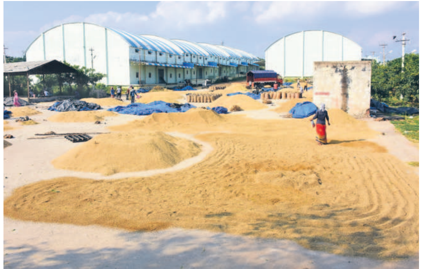
భువనగిరి మార్కెట్లో ఆరబోసిన ధాన్యం