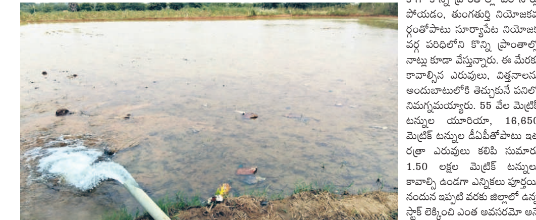
అర్ధస్థలి మండలం బొబ్బలపల్లిలో సిద్ధం చేసిన మడి

యాసంగి సాగు కోసం సూర్యాపేట జిల్లా రైతాంగం సిద్ధమవుతుంది. జిల్లాకు ఓ పక్కన ఉన్న నాగార్జునసాగర్లో నీళ్లు అడుగుటలంతో సాగర్ అయిత్తు పరిధిలోని చూజూర్ సాగర్, కోదాడతోపాటు సూర్యా పేట నియోజకవర్గంలోని కొంత ఏరియా రైతాంగం నిరాశతో ఉంది. మరో పక్క కాళేశ్వరం జిల్లాలు, మూసీ పుల్కా ఉండడంతో ఆయా ప్రాంతాల రైతులు సంతోషంగా ఉన్నారు. గతేడాది యాసంగిలో దాదాపు 5.45 లక్షల ఎకరాల్లో వరి నాట్లు వేయగా మరో 75 వేల ఎక రాల వరకు ఇతర పంటలు సాగు చేశారు. అయితే ఈ సారి మాత్రం సాగర్ అయిత్తులో పరిస్థితి ఆందోళనకరంగా మారడంతో దాదాపు 4