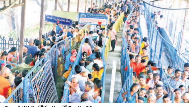
స్వామి వారి ధర్మసంకీర్ణం క్యూలో నిల్వన్న భక్తులు

సింగరేణిలో 27న జరిగే ఎన్నికల్లో 39,832 మంది కార్మికులు ఓటు హక్కును వినియోగించుకోనున్నారు. ఈ మేరకు కార్మిక సంఘాలకు ఓటు లిస్టును డిప్యూటీ లేబర్ కమిషనర్ శ్రీనివాసులు అందజేశారు. బెల్లపల్లి డివిజన్లో 985 మంది, మండపల్లిలో 4876 మంది, శ్రీరాంపూర్లో 9124 మంది, కొత్తగూడెం క్వార్టర్లలో 1192 మంది, కొత్తగూడెం డివిజన్లో 2370, మహబూబ్ నగర్లో 2414 మంది, ఇల్లందులో 603 మంది, ఒడిషాలో వైసిపి భూకుల కేవలం ఇద్దరు ఓటర్లు, భూపాలపల్లిలో 5350 మంది, రామగుండం-1లో 5490 మంది, అక్రీ-2లో 3479 మంది, అక్రీ-3లో 3063, ఏపీలో 944 మంది కార్మికులు ఓటు హక్కు వినియోగించుకోనున్నట్లు తెలిపారు.