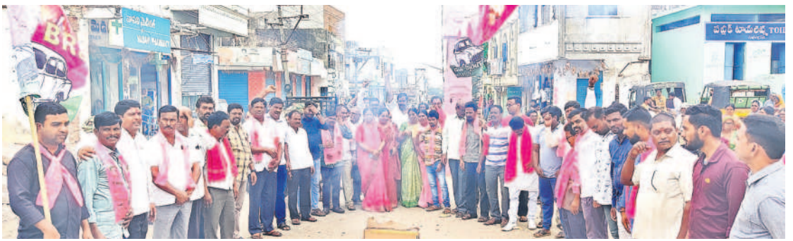
గంభీరాపురం: మండల కేంద్రంలోని అమరవీరుల స్తూపం వద్ద గినాదాలు చేస్తున్న జిఆర్ఎస్ నేతలు

నాడు కేవలం ఒకే ఒక్క ప్రభుత్వ డిగ్రీ కళాశాలనే పరిమితమైన సిరిసిల్ల నేడు ఎదుక్కేవనీ హాటిగా ఏర్పడింది. మెడికల్, వ్యవసాయ యూనివర్సిటీ,