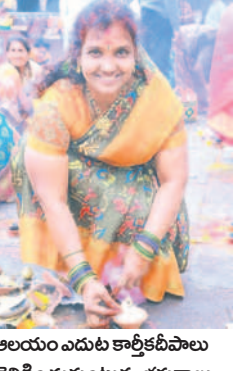
ఆలయం ఎదుట కార్మిక బీదలు వెలిగించుకుంటున్న భక్తులు