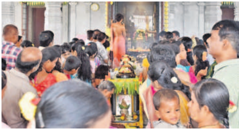
పెద్దఅంబర్పేట : భక్తులతో కిక్కిరిసిన ఆలయం

పెద్దఅంబర్పేట, డిసెంబర్ 4: ఉమ్మడి జిల్లావ్యాప్తంగా కార్తిక సోమ వారాన్ని పురస్కరించుకుని భక్తులు శివుడికి ప్రత్యేక పూజలు చేశారు. తెల్లవారుజాము నుంచే ఆలయాలకు చేరుకొని అభిషేకాలు, అర్చనలు నిర్వహించారు. దీపాలు వెలిగించి మొక్కులు చెల్లించుకున్నారు. పెద్దఅంబర్పేట మున్సిపాలిటీ పరిధి తట్టి అన్నారంలోని శ్రీలలితా భువనేశ్వరి సమేత చంద్రమౌళీశ్వర స్వామి ఆలయం భక్తులతో కిటకిటలాడింది.