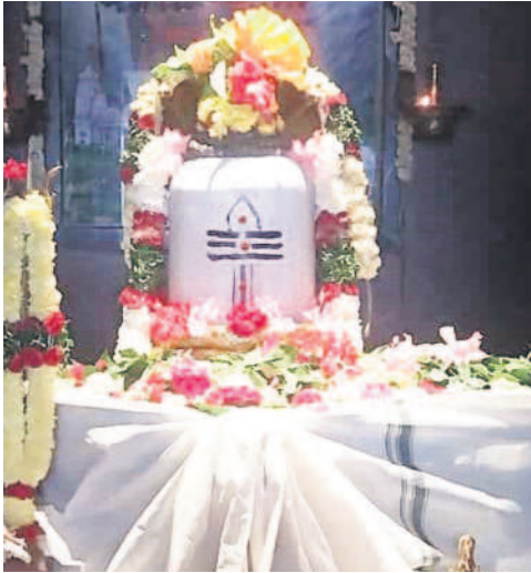
ప్రత్యేక ఆలంకరణలో శివలింగం

రంగారెడ్డి, డిసెంబర్ 4 (నమస్తే తెలంగాణ) : పోటీలో ఉన్న అభ్యర్థులు ఎవరూ నచ్చకపోతే ఓటు వేసేందుకు ఎన్నికల సంఘం ప్రత్యేకంగా నన్ ఆఫ్ ది ఎబ్ (నోటా)ను ప్రతి ఈవీ ఎంలో చివరన అందుబాటులోకి తెచ్చింది. ఈ క్రమంలో ఈసారి అసెంబ్లీ ఎన్నికల్లో రంగారెడ్డి జిల్లాలో 14,874 మంది 'నోటా'కు జై కొట్టారు. అత్యధికంగా శేరిలింగంపల్లిలో 3,145 మంది నోటా ఆప్షన్ ను ఎంచుకుంటే.. అత్యల్పంగా కల్వకుర్తిలో 661 మంది నోటా వైపు మొగ్గు చూపారు. గత ఎన్నికలతో పోలిస్తే నోటాను ఎంచుకుంటున్న ఓటర్ల సంఖ్య తగ్గుతూ వస్తున్నదని అధికారులు చెబుతున్నారు. రంగారెడ్డి జిల్లాలో నోటాకు వచ్చిన ఓట్లను నియోజకవర్గాల వారీగా పరిశీలిస్తే ఇబ్రహీంపల్లి నియోజకవర్గంలో 1,427, వేపేళ్ల 1,423, కల్వకుర్తి 661, ఎల్పీనగర్ 2,966, మహేశ్వరం 2,031, రాజేంద్రనగర్ 1,832, షాద్ నగర్ 1,389, శేరిలింగంపల్లిలో 3,145 ఓట్లు పోల్ అయ్యాయి.