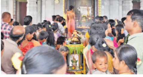
పెద్దఅంబర్పేట : భక్తులతో కిక్కిరిసిన ఆలయం

పెద్దఅంబర్పేట, డిసెంబర్ 4: ఉమ్మడి జిల్లావ్యాప్తంగా కార్తిక సోమ వారాన్ని పురస్కరించుకుని భక్తులు శివుడికి ప్రత్యేక పూజలు చేశారు. తెల్లవారుజాము నుంచే ఆలయాలకు చేరుకొని అభిషేకాలు, అర్చనలు నిర్వహించారు. దీపాలు వెలిగించి మొక్కులు చెల్లించుకున్నారు. పెద్దఅంబర్పేట మున్సిపాలిటీ పరిధి తట్టి అన్నారంలోని శ్రీలలితా భువనేశ్వరి సమేత చంద్రమౌళీశ్వర స్వామి ఆలయం భక్తులతో కిటకిటలాడింది.