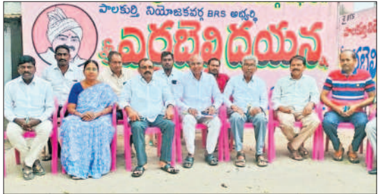
రాయపల్లిలో మాట్లాడుతున్న బీఆర్ఎస్ నాయకులు