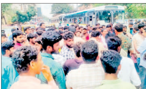
కాలేజీ ఎదుట ఆందోళన చేస్తున్న విద్యార్థులు

హనుమకొండ చౌరస్తా, డిసెంబర్ 4 : యూనివర్సిటీ ఫీజులు పేరిట అదనంగా వసూలు చేస్తున్నారని కేడీసీ విద్యార్థులు రోడ్డెక్కిారు. హనుమకొండలోని కాకతీయ ప్రభుత్వ డిగ్రీ కాలేజీ (కేడీసీ)లో అదనపు ఫీజుల వసూలుకు నిరసనగా విద్యార్థులు సోమవారం కాలేజీ ఎదుట నిరసన తెలిపారు. తమకు న్యాయం చేయాలంటూ రాస్తారోకో చేశారు. అదనంగా వసూలు చేస్తున్న యూనివర్సిటీ ఫీజులను వెంటనే రద్దు చేయాలని డిమాండ్ చేశారు. ప్రిన్సిపాల్ కు వ్యతిరేకంగా నినాదాలు చేశారు. విషయం తెలుసుకున్న హనుమకొండ పోలీసులు అక్కడికి చేరుకుని విద్యార్థులకు నచ్చజెప్పే ప్రయత్నాలు చేసినప్పటికీ వారు వినలేదు. దీంతో కొద్దిసేపు ట్రాఫిక్ కు అంతరాయం ఏర్పడింది. ఈ సందర్భంగా పలువురు విద్యార్థులు మాట్లాడుతూ యూనివర్సిటీ ఫీజు పేరిట విద్యార్థుల నుంచి ఏటా అదనంగా