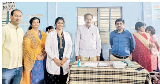
వైద్యశిబిరాన్ని నిర్వహిస్తున్న ప్రతిమ హాస్పిటల్ వైద్యులు