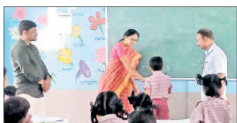
పాఠశాలలో విద్యార్థులతో మాట్లాడుతున్న సీఎంవో రాధ

వర్ధన్నపేట, డిసెంబర్ 4 : మండలంలోని ఇల్లంద శివారులో ఉన్న కోమటి కుంటలను పరిరక్షించాలని గ్రామానికి చెందిన మాజీ ప్రజాప్రతినిధులు, యువకులు సోమవారం అధికారులకు వినతి పత్రం అందజేశారు. ఈ సందర్భంగా వారు మాట్లాడుతూ గ్రామానికి ఆసుకొని రహదారి పక్కనే ఉన్న కుంట కట్టను తొలగించి భూమిని విక్రయించేందుకు కొందరు ప్రయత్నిస్తున్నారని, దాన్ని వెంటనే నిలిపి వేయాలని కోరారు. దశాబ్దాల క్రితం ప్రజల అవసరాల కోసం పూర్వీకులు కుంటను నిర్మించినట్లు పేర్కొన్నారు. కానీ, కొంత మంది ఈ కుంట తవ్వడేనని చెప్పి దశాబ్దాల సహకారంతో కట్టను తొలగించి విక్రయించేందుకు ప్రయత్నిస్తున్నారని ఆరోపించారు. ఇప్పటికేనా అధికారులు చర్యలు తీసుకోవాలని కోరారు.