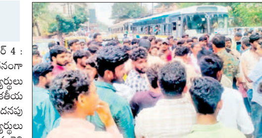
కాలేజీ ఎదుట ఆందోళన చేస్తున్న విద్యార్థులు

హనుమకొండ చౌరస్తా, డిసెంబర్ 4 : యూనివర్సిటీ ఫీజులు పేరిట అదనంగా వసూలు చేస్తున్నారని కేడీసీ విద్యార్థులు రోడ్డెక్కిారు. హనుమకొండలోని కాకతీయ ప్రభుత్వ డిగ్రీ కాలేజీ (కేడీసీ)లో అదనపు ఫీజుల వసూలుకు నిరసనగా విద్యార్థులు సోమవారం కాలేజీ ఎదుట నిరసన తెలిపారు. తమకు న్యాయం చేయాలంటూ రాస్తారోకో చేశారు. అదనంగా వసూలు చేస్తున్న యూనివర్సిటీ ఫీజులను వెంటనే రద్దు చేయాలని డిమాండ్ చేశారు. ప్రిన్సిపాల్ కు వ్యతిరేకంగా నినాదాలు చేశారు. విషయం తెలుసుకున్న హనుమకొండ పోలీసులు అక్కడికి చేరుకుని విద్యార్థులకు నచ్చజెప్పే ప్రయత్నాలు చేసినప్పటికీ వారు వినలేదు. దీంతో కొద్దిసేపు ట్రాఫిక్ కు అంతరాయం ఏర్పడింది. ఈ సందర్భంగా పలువురు విద్యార్థులు మాట్లాడుతూ యూనివర్సిటీ ఫీజు పేరిట విద్యార్థుల నుంచి ఏటా అదనంగా