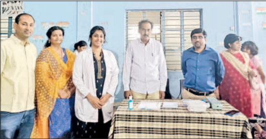
వైద్యశిబిరాన్ని నిర్వహిస్తున్న ప్రతిమ హాస్పిటల్ వైద్యులు