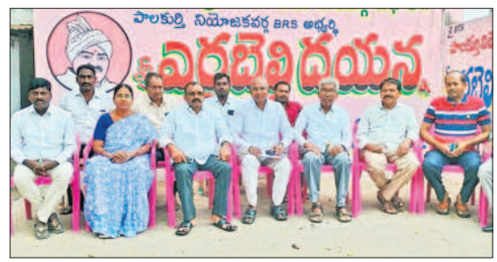
రాయపల్లిలో మాట్లాడుతున్న బీఆర్ఎస్ నాయకులు