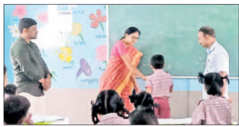
పాఠశాలలో విద్యార్థులతో మాట్లాడుతున్న సీఎంవో రాధ

వర్ధన్నపేట, డిసెంబర్ 4 : మండలంలోని ఇల్లంద శివారులో ఉన్న కోమటి కుంటలను పరిరక్షించాలని గ్రామానికి చెందిన మాజీ ప్రజాప్రతినిధులు, యువకులు సోమవారం అధికారులకు వినతి పత్రం అందజేశారు. ఈ సందర్భంగా వారు మాట్లాడుతూ గ్రామానికి ఆసుకొని రహదారి పక్కనే ఉన్న కుంట కట్టను తొలగించి భూమిని విక్రయించేందుకు కొందరు ప్రయత్నిస్తున్నారని, దాన్ని వెంటనే నిలిపి వేయాలని కోరారు. దశాబ్దాల క్రితం ప్రజల అవసరాల కోసం పూర్వీకులు కుంటను నిర్మించినట్లు పేర్కొన్నారు. కానీ, కొంత మంది ఈ కుంట తమదేనని చెప్పి దశాబ్దాల సహకారంతో కట్టను తొలగించి విక్రయించేందుకు ప్రయత్నిస్తున్నారని ఆరోపించారు. ఇప్పటికైనా అధికారులు చర్యలు తీసుకోవాలని కోరారు.