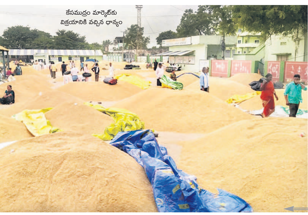
కేసముద్రం మార్కెట్ కు విక్రయానికి వచ్చిన ధాన్యం