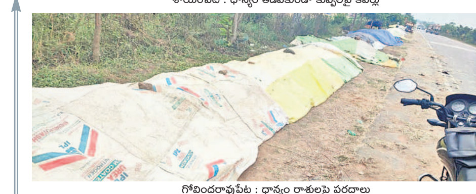
కాయపేట : ధాన్యం తడవకుండా కప్పలపై కవర్లు

మంగపేట: ధాన్యం రాకుండా టార్పాలిన్ పీట్లు కప్పేస్తున్న రైతులు ఆందోళన కలిగిస్తున్న తుఫాన్ హెచ్చరికలు ఒక్కసారిగా కమ్మకున్న మబ్బు కల్లాలు, రోడ్లపై ధాన్యం కుప్పలు.. పరదాలు కప్పి అప్రమత్తం మిరపకు ఆకుముడత సోకే ప్రమాదం