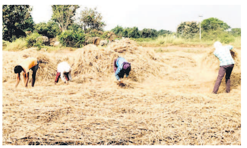
వరి మెదలను ట్రాక్టర్ తో తొక్కింది గడ్డి, వడ్లను వేరు చేస్తున్న రైతులు

అంతర్జియలకు హాజరుకానున్న కేటీఆర్ పాగాల అంతర్జియలను రాజవరంలోని వ్యవసాయ క్షేత్రంలో నేడు మధ్యాహ్నం నిర్వహించనున్నారు. కార్యక్రమానికి బీఆర్ఎస్ వర్కింగ్ ప్రెసిడెంట్ కేటీఆర్ హాజరుకానున్నారు. చిన్నగూడూరు, డిసెంబర్ 4 : వరి కోతలు జరిగింది నాాయి. ఏ గ్రామంలో చూసినా హార్వెస్టర్ తో కోత కొయిస్తూ, వడ్లను తూర్పార వదుతూ, మెదలను ట్రాక్టర్ తో తొక్కించే పనులతో రైతులు, కూలీలు బజ్జిబి జీగా కనిపిస్తున్నారు. కొన్నిచోట్ల రైతులు స్వయంగా చేతులతో కోత పనులు చేస్తుండగా ఎక్కువ మంది యంత్రాలు వినియోగిస్తున్నారు. గిరాకీ ఎక్కువగా ఉంటుండడంతో ప్రతి గ్రామంలో హార్వెస్టర్ సంఖ్య ఐదు నుంచి పదికి పెరిగింది. చెరువులు, కుంటల్లో నీరు పువ్వులంగా ఉండడం వల్ల రైతులు మిల్లి, పత్తి పంటలతో పాటు వరిసాగుపై రైతులు ఆసక్తిని చూపుతున్నారు. రెండు నెలల పాటు కూలి పనులకు ధోకా లేదని ఆయా గ్రామాల్లో వ్యవసాయ కూలీలు చెబుతున్నారు. తెల్లవారుజాము నుంచే వ్యవసాయ పనులకు వెళ్తుండడంతో ఉదయం నుంచి సాయంత్రం వరకు పంట కోసం శ్రమిస్తున్నారు.