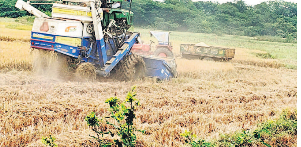
చిన్నగూడూరు మండలకేంద్రంలో వరి కోస్తున్న హార్వెస్టర్

బజ్జిబి జీగా రైతులు, కూలీలు.. హార్వెస్టర్లకు పుల్ గిరాకీ