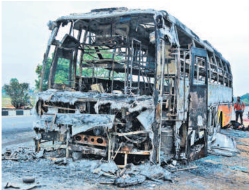
పూర్తిగా దగ్ధమైన ట్రావెల్స్ బస్సు