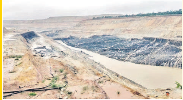
నత్తుపల్లి : ఓసీలో నిలిచిన నీరు