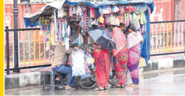
ఖమ్మం నగరంలో కురుస్తున్న వర్షంలో వ్యాపారులు