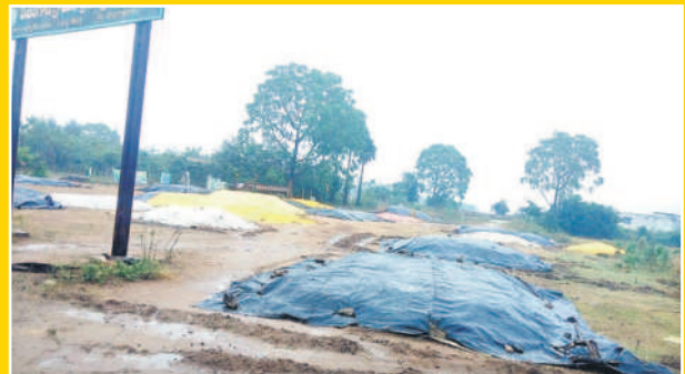
పాల్వంచ రూరల్ : సామలగూడెంలో ధాన్యంపై పట్టాలు కప్పిన రైతులు