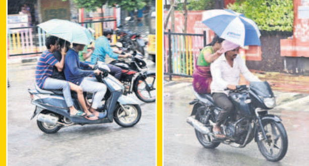
ఖమ్మం నగరంలో కురుస్తున్న వాన ముసురుకు ద్విచక్ర వాహనదారుల ఇబ్బందులు