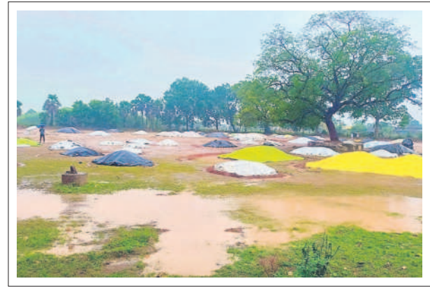
బుక్కంపహాడ : అంజనాపురంలో ధాన్యం రాశులు తడవకుండా కప్పి ఉన్న పరదాలు