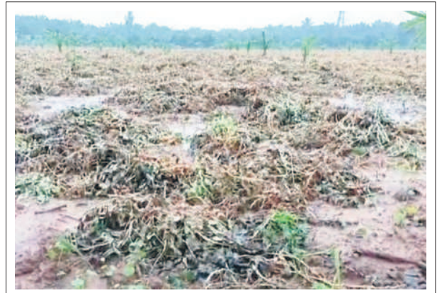
అశ్వారావుపేట రూరల్ : తిరుమలకుంటలో తుపాన్ కు తడిసిన వెరుశనగ