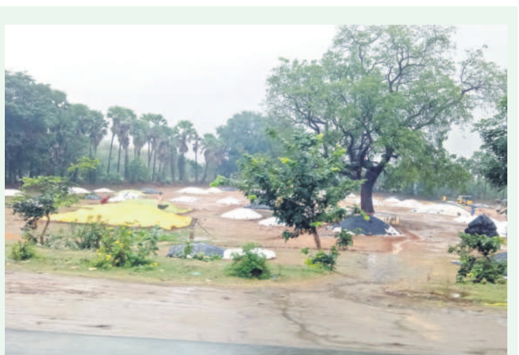
బూర్గంపాడు మండలం అంజనాపురంలో పొలంలో ఆరబోసిన ధాన్యంపై పరదాలు కప్పకున్న రైతులు

సత్తుపల్లి, డిసెంబర్ 5 : బంగాళాఖాతంలో ఏర్పడిన మిచౌంగ్ తుపాన్ ప్రభావంతో సోమవారం రాత్రి నుంచి మండల వ్యాప్తంగా వర్షం కురుస్తోంది. ఈ నేపథ్యంలో చేతి కొచ్చిన వరి ధాన్యాన్ని కల్లాల్లో ఆరబోసుకున్న రైతులు వర్షంతో తీవ్ర అవస్థలకు గురవుతున్నారు. ధాన్యం తడవకుండా టార్పాలిన్ పట్టాలు కప్పి జాగ్రత్త చర్యలు చేపట్టారు. మరోపక్క సింగరేణి ఓపెన్ కాస్ట్ గనుల్లో నీరు నిలవడంతో బొగ్గు ఉత్పత్తికి ఆటంకం కలిగింది. కిష్టార ఓసీలో 5వేల టన్నుల బొగ్గు, 25వేల క్యూబిక్ మీటర్ల మట్టి వెలికితీత పనులకు ఆటంకం కలిగింది. జేపీఆర్ ఓసీలో 25వేల టన్నుల బొగ్గు, 1.25లక్షల క్యూబిక్ మీటర్ల మట్టి వెలికితీతకు ఆటంకం ఏర్పడినట్లు సింగరేణి అధికారులు తెలిపారు.