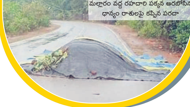
మల్లారం వద్ద రహదారి పక్కన ఆరబోసిన ధాన్యం రాశులపై కప్పిన పరదా