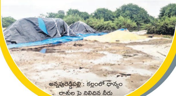
అన్నపురెడ్డిపల్లి : కల్లంలో ధాన్యం రాశుల పై నిలిచిన నీరు