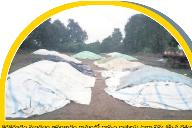
కడకగూడెం మండలం అనంకారం గ్రామంలో ధాన్యం రాశులపై టార్పాలిన్లు కప్పిన రైతులు