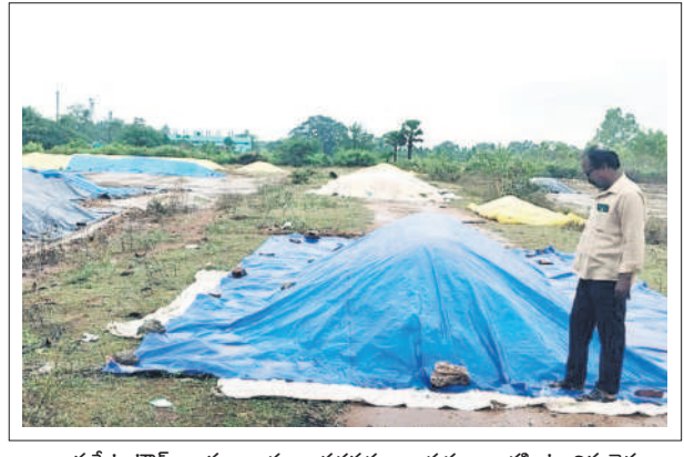
అశ్వారావుపేట టౌన్ : ధాన్యం రాశులు తడవకుండా పరదాలు కప్పిఉంచిన రైతు