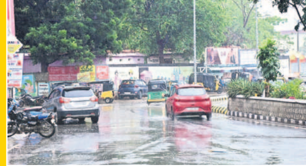
ఖమ్మం నగరంలో ..