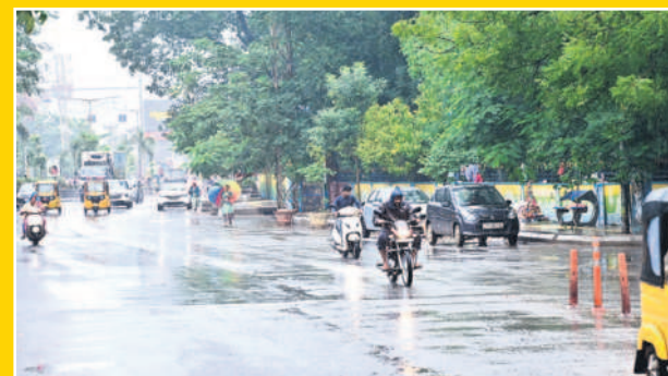
ఖమ్మం పట్టణంలో కురుస్తున్న వర్షం