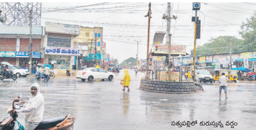
నత్తుపల్లిలో కురుస్తున్న వర్షం