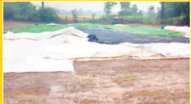
దుమ్మగూడెం: ధాన్యం రాశులపై కప్పిన పరదాలు