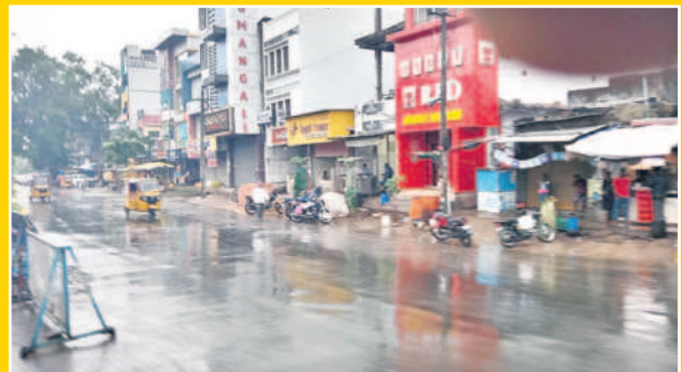
కొత్తగూడెంలో కురుస్తున్న వర్షం