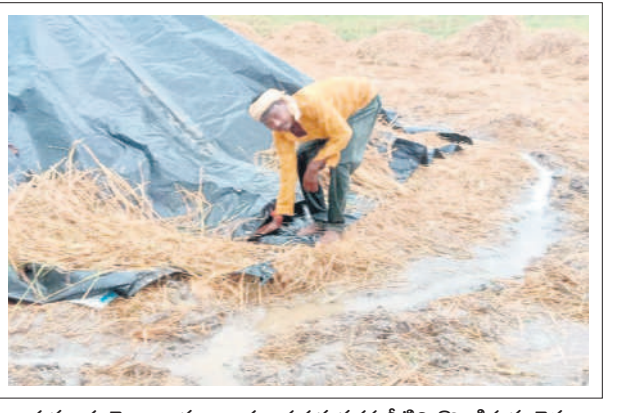
దుమ్మగూడెం : ధాన్యం రాశుల పక్కన వర్షపునీటిని తొలగిస్తున్న రైతు