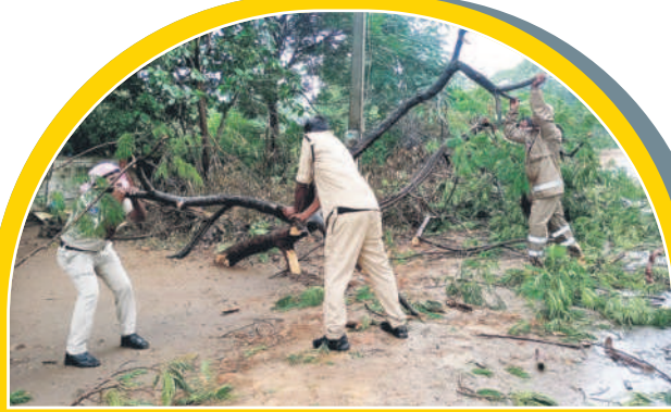
కొణిజర్ల : రోడ్డుపై అడ్డంగా వడిన చెట్లను తొలగిస్తున్న పోలీసులు