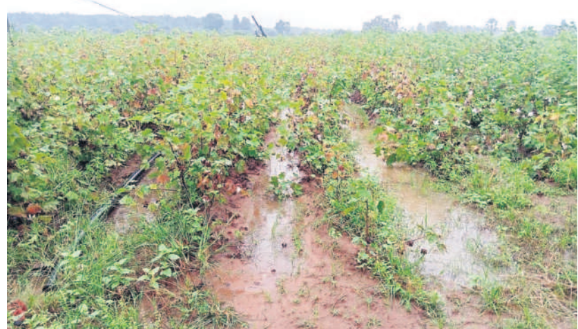
అన్నపురెడ్డిపల్లి : పత్తి చేనులో నిలిచిన నీరు

ఖమ్మం, డిసెంబర్ 5 (నమస్తే తెలంగాణ ప్రతినీది) : బంగాళాఖాతంలో ఏర్పడిన అల్పవీడన ప్రభావం ఉమ్మడి ఖమ్మం జిల్లాపై స్పష్టంగా కనపడింది. సోమవారం రాత్రి నుంచి ఒక్కసారిగా వానముసురు ప్రారంభమైంది. తెల్లవారుజామున ఓ మోస్తరు నుంచి భారీ వర్షం కురిసింది. తెల్ల వారుజాము నుంచి రాత్రి వరకు వాన ముసురు వీడలేదు. ఎడతెరిపిలేకుండా కురిసిన వర్షానికి ఖమ్మం నగరం తడిసి ముద్దైంది. ప్రధానమీధులన్నీ జలమయం కావడంతో పాద చారులు, ద్వీచక్ర వాహనదారులు అవస్థలు పడ్డారు. నాలాలు పొంగడంతో మురుగునీరు రోడ్లపైకి వచ్చి చేరింది. పాఠశాలలకు సెలవులు ప్రకటించడంతో విద్యార్థులకు ఇబ్బందులు తప్పాయి. నగరంలో పరిస్థితి ఇలా ఉండగా.. పల్లెల్లో మరోవిధంగా కనిపించింది. ప్రస్తుతం వ్యవసాయ పనులు జోరుగా కొనసాగుతుండడంతో రైతులు, రైతు కూలీలు ఇంటిని వదిలి బయటకు పోలేని పరిస్థితి నెలకొంది. పత్తితీత పనులు జోరుగా సాగుతున్న ఈ తరుణంలో తుపాన్ రావడంతో పత్తి పంట ఎర్రబారడంతోపాటు దూది నాణ్యత కోల్పోయే అవకాశం ఉంది. ఇక మిర్చి తోటలు ఏరివేత దళకు చేరుకున్నాయి. వాన కాలం సాగు చేపట్టిన వరి పొలాలు సైతం చేతికొచ్చాయి. ఆయా గ్రామాల్లో కల్లాల్లో మిర్చి, ధాన్యం పంటను రైతులు నిల్వ చేసుకున్నారు. నిరంతరాయంగా వర్షం కురుస్తుండడంతో పంటను కాపాడుకునేందుకు రైతులు నానా యాతన పడ్డారు. వానముసురుతోపాటు ఈదురుగాలులు సైతం తోడుకావడంతో వృద్ధులు, చిన్నారులు ఇబ్బందులు పడ్డారు. దినసరి కూలీలు సైతం ఉదయం అడ్డాల వద్ద