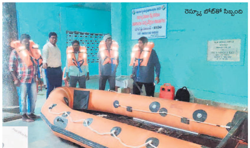
రెస్క్యూ బోట్ తో సిబ్బంది

చర్యల కోసం ఒక్కో బోటును రూ.8లక్షల వ్యయంతో కొనుగోలు చేసి 20 మంది సిబ్బందికి ప్రత్యేక శిక్షణ ఇచ్చారు. జిల్లాలో రెండు రోజులుగా కురుస్తున్న వర్షాల నేపథ్యంలో సత్తుపల్లికి ఈ బోటును తరలించారు. సత్తుపల్లి పరిసర ప్రాంతాల్లో వరద సహాయక చర్యల్లో పాల్గొనేందుకు బోటును ఉపయోగించనున్నట్లు సిబ్బంది తెలిపారు.