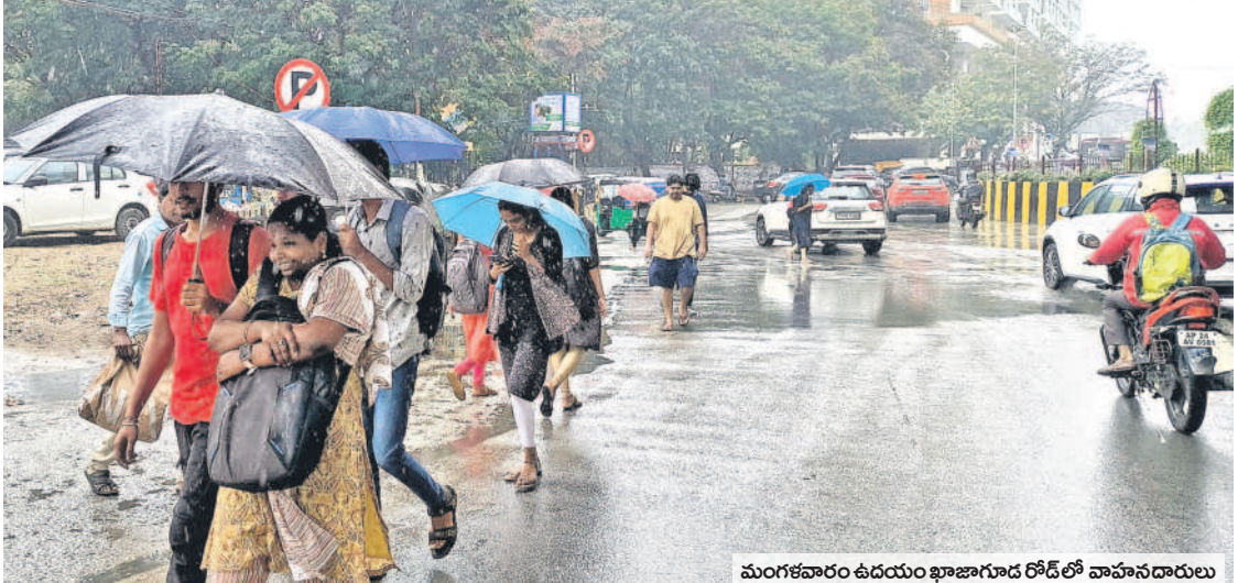
మంగళవారం ఉదయం ఖాజూరుడ రోడ్ లో వాహనదారులు

సిటీబ్యూరో, డిసెంబర్ 5 (నమస్తే తెలంగాణ) : మిగ్ జాం ప్రభావంతో నగరవాసులు తీవ్ర ఇబ్బందులకు గురయ్యారు. ఈదురుగాలులు తీవ్రంగా వీచడంతో ఇంట్లో నుంచి బయటకు వెళ్లేందుకు ప్రజలు ఇష్టపడలేదు. మంగళవారం నుంచి కురుస్తున్న వర్షానికి విద్యార్థులు, ప్రజలు, పలు కార్యాలయాలకు వెళ్లే ఉద్యోగులు రాకపోకల్లో ఇబ్బందులను ఎదుర్కొన్నారు. రెండు రోజులపాటు వర్షాలు పడి అవకాశం ఉన్నట్లు హైదరాబాద్ వాతావరణ కేంద్రం వెల్లడించింది. నగరవాసులు పలు జాగ్రత్తలు పాటించాలని వాతావరణ శాఖ అధికారులు సూచించారు. నగరంలో మంగళవారం గరిష్ట ఉష్ణోగ్రత 24.6 డిగ్రీలు, కనిష్ట ఉష్ణోగ్రత 20.6 డిగ్రీ సెల్సియస్ గా, గాలిలో తేమ 80 శాతంగా నమోదైనట్లు వాతావరణ శాఖ అధికారులు వెల్లడించారు.