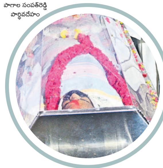
పాగాల సంపత్ రెడ్డి పార్లమెంటుపై