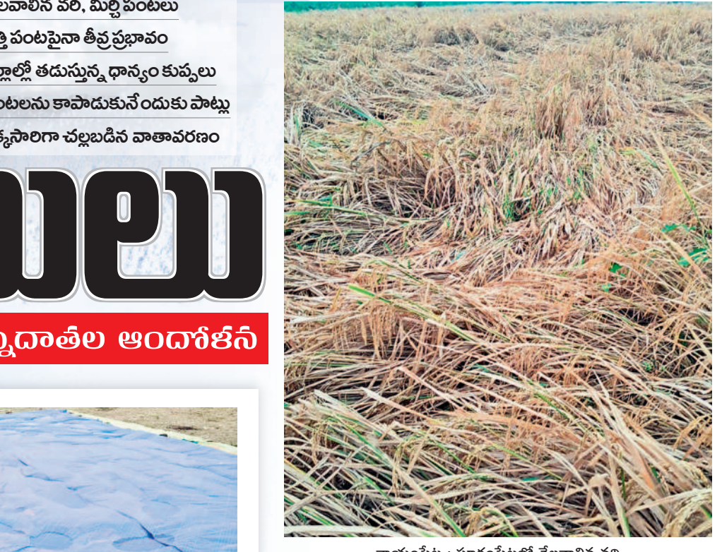
కాయంపేట : నూరంపేటలో నేలవాలిన పరి