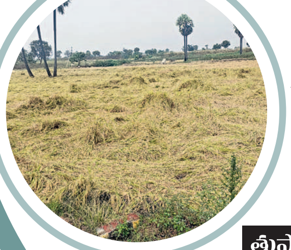
అత్తకూరు : హొంబుబుజర్లలో నేలవాలిన పరి