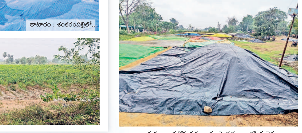
ఖానాపూరు : ఆరబోసుకున్న ధాన్యంపై పరదాలు కప్పిన రైతులు