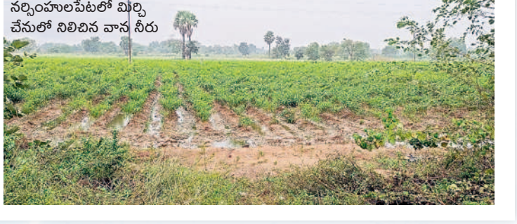
నర్సంపాలపేటలో మిర్చి చేసులో నిలిచిన వాన నీరు