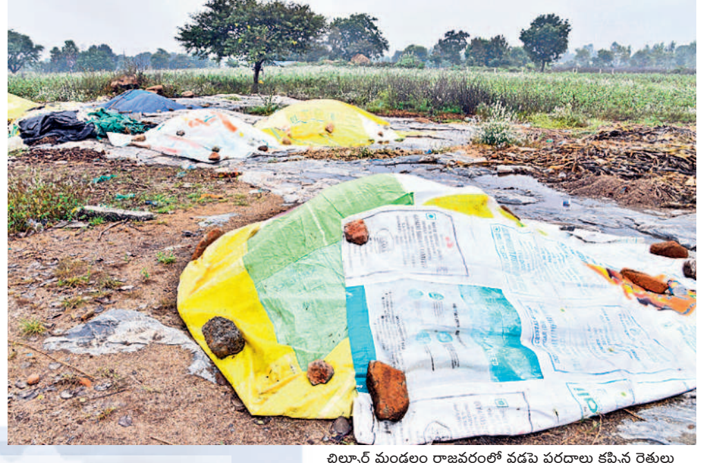
బిల్వూర్ మండలం రాజవరంలో వడ్లపై పరదాలు కప్పిన రైతులు