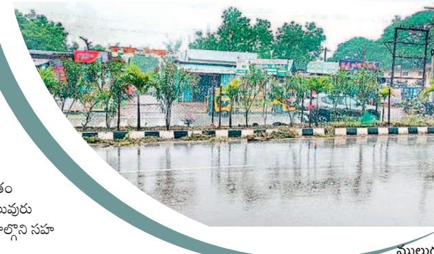
ములుగులో కురుస్తున్న వర్షం