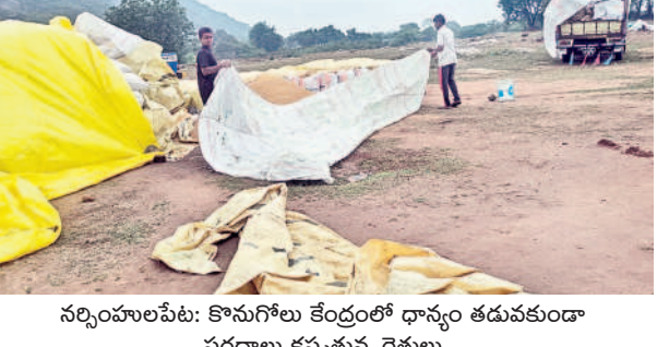
నర్సంపాలపేట: కొనుగోలు కేంద్రంలో ధాన్యం తడువకుండా పరదాలు కప్పిస్తున్న రైతులు