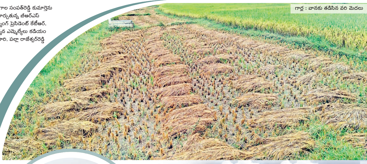
గార్ల : వానకు తడిసిన పరి మెదలు