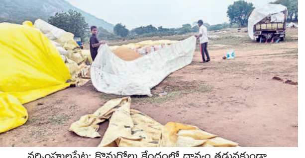
నర్సంపాలపేట: కొనుగోలు కేంద్రంలో ధాన్యం తడువకుండా పరదాలు కప్పిస్తున్న రైతులు