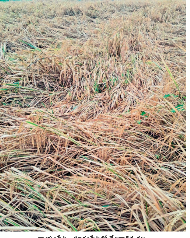
కాయంపేట : సూరంపేటలో నేలవాలిన వరి