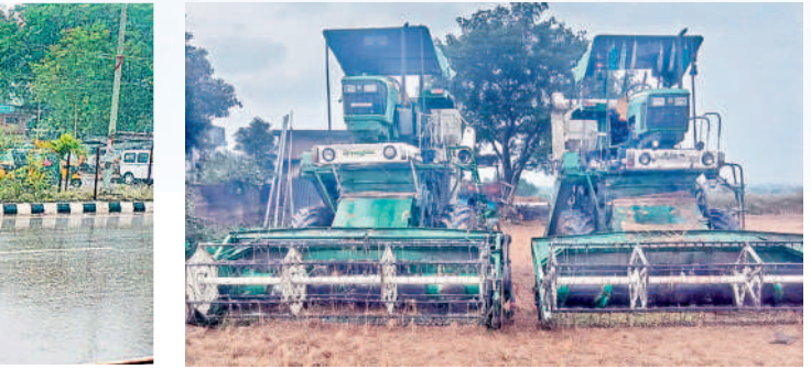
గార్ల : వర్షం కారణంగా పొలంలోనే ఖాళీగా ఉన్న వరికోత మిషన్లు