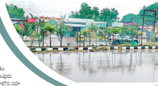
ములుగులో కురుస్తున్న వర్షం