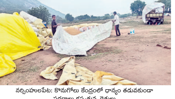
నర్సంపాలపేట: కొనుగోలు కేంద్రంలో ధాన్యం తడువకుండా పరదాలు కప్పిస్తున్న రైతులు