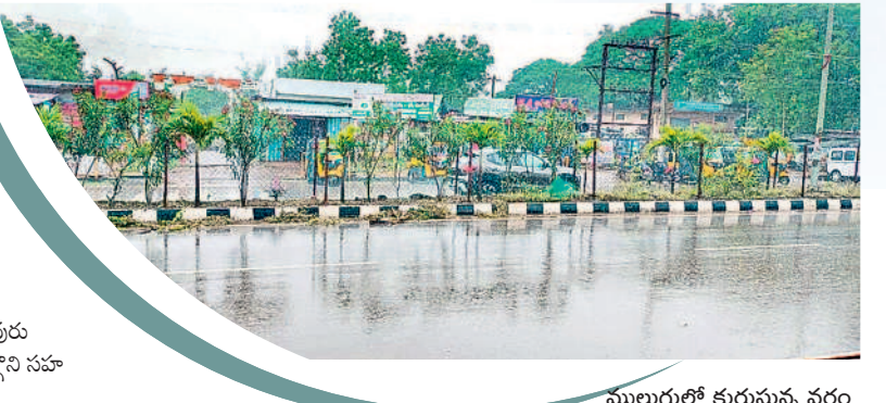
ములుగులో కురుస్తున్న వర్షం