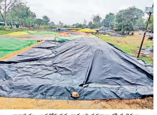
ఖానాపూరు : ఆరబోతున్న ధాన్యంపై పరదాలు కప్పిన రైతులు