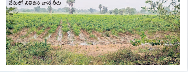
కాటారం : శంకరంపల్లిలో..