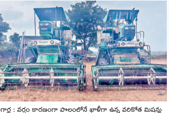
గార్ల : వర్షం కారణంగా పొలంలోనే ఖాళీగా ఉన్న వరికోత మిషన్లు