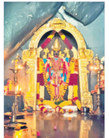
కాంచన గుహలో కొలువుదీరిన స్వామి వారు

దేవరకర్ణ రూరల్ (చిన్నచింతకుంట), డిసెంబర్ 5 : ఉమ్మడి పాలమూరు జిల్లాలోని చిన్నచింతకుంట మండలం లోని అమ్మపూర్ గ్రామ సమీపంలోని సప్త గిరులోని కాంచన గుహలో కొలువు తీరిన కురుమూర్తి స్వామి జాతర వేడుకలు కొనసాగుతున్నాయి. ఆలయ అర్చకులు మంగళవారం స్వామివారికి నిత్యపూజలు నిర్వహించారు. భక్తులు ఆలయ ప్రాంగణంలోని పుష్పరిణిలో పుణ్యస్నానాలు ఆచరించి, కొత్త కుండల్లో పచ్చిపులుసు అన్నం, పాయసం తయారు చేసి నైవేద్యాలు సమర్పించి మొక్కులు చెల్లించుకున్నారు. జాతర లో ఉన్న మిఠాయి దుకాణాల్లో మిఠాయిలు, చిన్న పిల్లల ఆటవస్తువులు కొనుగోలు చేయడంతో ప్రాంగణమంతా సందడి వాతావరణం నెలకొన్నది.