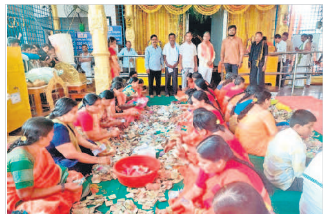
హుండీ లెక్కింపు సందర్భంగా, భక్తులు