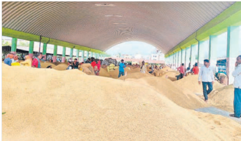
బాదేపల్లి వ్యవసాయ మార్కెట్ కు అమ్మకానికి వచ్చిన ధాన్యం

ట్లో ఆర్ఎన్ఆర్ రకం ధాన్యానికి క్వింటాకు రూ.3,251 ధర పలికింది. ఇప్పటివరకు ఎన్నడూ పలకని ధరలు ధాన్యానికి వస్తుండటంతో రైతుల్లో ఆనందం వ్యక్తం అవుతుంది. క్వింటా రూ.2వేలు వస్తే అది పెట్టుబడి ఖర్చులకే పోయేది కానీ ప్రస్తుతం ధర రూ.3వేలు దాటడంతో రైతులు చాలా సంతోషంగా ఉన్నారు. మంచి ధరలు వస్తుండటంతో యాసంగిలో వరిసాగు పెరిగే అవకాశం ఉందని అధికారులు అభిప్రాయం వ్యక్తం చేస్తున్నారు. మార్కెట్ ధాన్యం, మొక్కజొన్న, వేరుశనగ అమ్మకానికి వచ్చాయి. మార్కెట్ కు 18,697 క్వింటాళ్ళ ఆర్ఎన్ఆర్ రకం ధాన్యం అమ్మకానికి రాగా దానికి క్వింటాకు గరిష్టంగా రూ.3,251 ధర రాగా కనిష్టంగా రూ.1,821, మధ్యస్థంగా రూ.3,156 ధర పలికింది. అదేవిధంగా మార్కెట్ కు 284 క్వింటాళ్ళ మొక్కజొన్న అమ్మకానికి రాగా దానికి క్వింటాకు గరిష్టంగా రూ.2,347 ధర రాగా కనిష్టంగా రూ.2,100, మధ్యస్థంగా రూ.2,327 ధర పలికింది. అదేవిధంగా మార్కెట్ కు 522 క్వింటాళ్ళ హంసధాన్యం అమ్మకానికి రాగా దానికి క్వింటాకు గరిష్టంగా రూ.2,325 ధర పలికింది. అదేవిధంగా మార్కెట్ కు 6 క్వింటాళ్ళ వేరుశనగ అమ్మకానికి రాగా దానికి క్వింటాకు గరిష్టంగా రూ.5,689 ధర పలికింది.