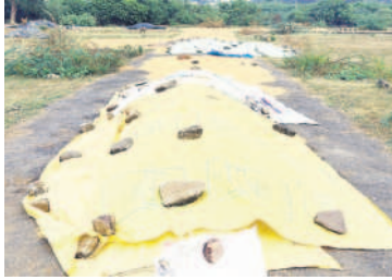
కొనుగోలు కేంద్రాలలో అరటినిని ధాన్యం

జిల్లాలో పత్తి పంట 1,47,515.99 ఎకరాల్లో రైతులు సాగు చేశారు. దీపావళి నుంచే పత్తి ఏకరం మొదలు పెట్టిన రైతులు నవంబర్, డిసెంబర్