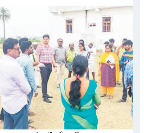
లక్షణచాంద్, వరికొనుగోలు కేంద్రంలో అధికారులను వివరాలు అడుగుతున్న జిల్లా కలెక్టర్ ఆశిష్ సంగ్యాన్

లక్షణచాంద్, డిసెంబర్ 5: వరి కొనుగోలు కేంద్రాల్లో రైతులకు ఇబ్బందులేకుండా చర్యలు తీసుకోవాలని జిల్లా కలెక్టర్ ఆశిష్ సంగ్యాన్ పేర్కొన్నారు. మండలంలోని వచ్చాల్, రాచాపూర్, లక్ష్మణచాంద్ వరి కొనుగోలు కేంద్రాలను మంగళవారం పరిశీలించారు. ఈ సందర్భంగా ఆయా మార్కెటుకూ వర్షాలు కురిసే అవకాశం ఉండడంతో కొనుగోలు చేసిన ధాన్యం తడిసిపోకుండా జాగ్రత్తలు తీసుకోవాలని ఆదేశించారు. కొనుగోలు చేసేముందు సరైన తేమను పరిశీలించాలని సూచించారు. కొనుగోలు చేసిన ధాన్యం వివరాలు ఎప్పటికప్పుడు ఆన్లైన్లో సమాను చేయాలని పేర్కొన్నారు. తనా సీనియర్ శ్రీలత, కొనుగోలు కేంద్రాల సిబ్బంది ఉన్నారు.