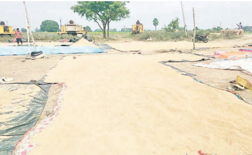
మామడ మండలం కొరిబేకల్లో ఏర్పాటు చేసిన కొనుగోలు కేంద్రంలో వడ్డను ఆరదీసిన రైతులు