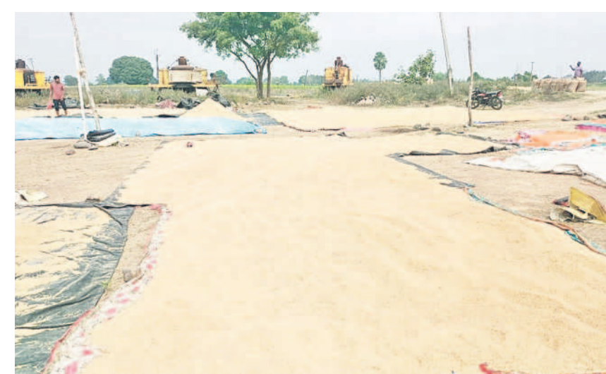
మామడ మండలం కొరిబేకల్లో ఏర్పాటు చేసిన కొనుగోలు కేంద్రంలో వడ్డను ఆరబోసిన రైతులు