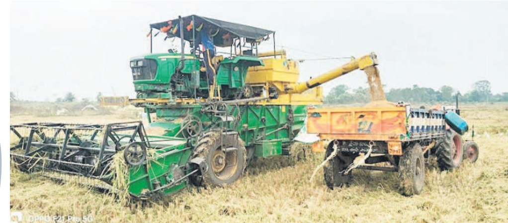
ఆసిఫామాల్ జిల్లాలో యంత్రాలతో జోరుగా సాగుతున్న వరికోతలు