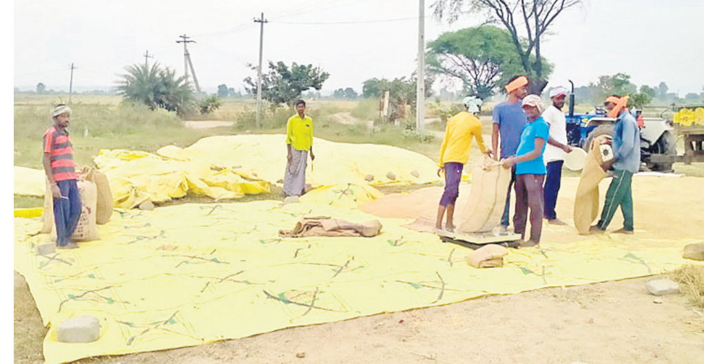
దహంగాలో వ్యవసాయ కేంద్రాల్లో వరి ధాన్యం కొనుగోలు చేస్తున్న వ్యాపారులు

జిల్లాలో ఈ ఏడాది ఎన్నికల కారణంగా ప్రభుత్వ పరిధాన్యం కొనుగోలు కేంద్రాలు ఇంకా జిల్లాలో ప్రారంభించలేదు. దీంతో ప్రైవేటు వ్యాపారులు వరి కల్లాల్లోనే తాత్కాలిక కొనుగోలు కేంద్రాలు ఏర్పాటు చేసి ధాన్యం కొంటున్నారు. క్వింటాలుకు రూ. 1900 నుంచి రూ. 2వేల వరకు చెల్లిస్తున్నారు. ఎఫ్సీఐ ద్వారా జిల్లాలో ఇంకా ధాన్యం కొనుగోలు కేంద్రాలు ప్రారంభం కాకపోవడంతో, వ్యాపారులే రంగంలోనికి దిగి ధాన్యాన్ని కొనుగోలు చేస్తున్నారు. జిల్లాలో గత ఐదేళ్ల కాలంలో సాగు విస్తీర్ణం భారీ స్థాయిలో పెరిగింది. ప్రస్తుతం జిల్లాలో సాగు 4.85 వేల ఎకరాల్లో సాగు అవుతున్నది. ఐదేళ్ల కాలంలో దాదాపు 1 లక్షా 10 వేల ఎకరాల్లో సాగు పెరిగింది. ఉచిత విద్యుత్, రైతులకు బోర్ల ద్వారా సాగునీరు పుష్కలంగా తగ్గినప్పటికీ, సుమారు 10 నుంచి 12 లక్షల క్వింటాళ్ల దిగుబడి వస్తుందని అధికారులు అంచనా వేస్తున్నారు.