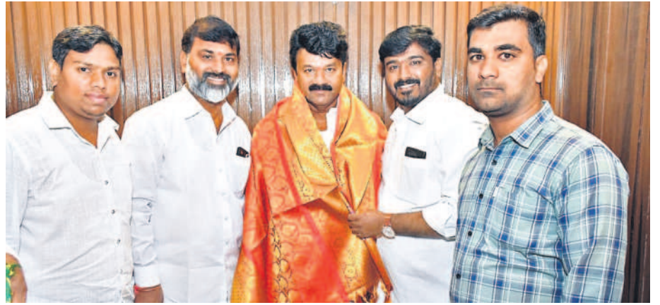
ఎమ్మెల్యే తలసాని శ్రీనివాస్ యాదవ్ ను సాలువారితో సత్కరించి శుభాకాంక్షలు తెలుపుతున్న బేగంపేట్ డివిజన్ తిఆర్ఎస్ పార్టీ నాయకులు

అధైర్యవడొద్దు.. అండగా నేనున్నా | ఎమ్మెల్యే తలసాని శ్రీనివాస్ యాదవ్