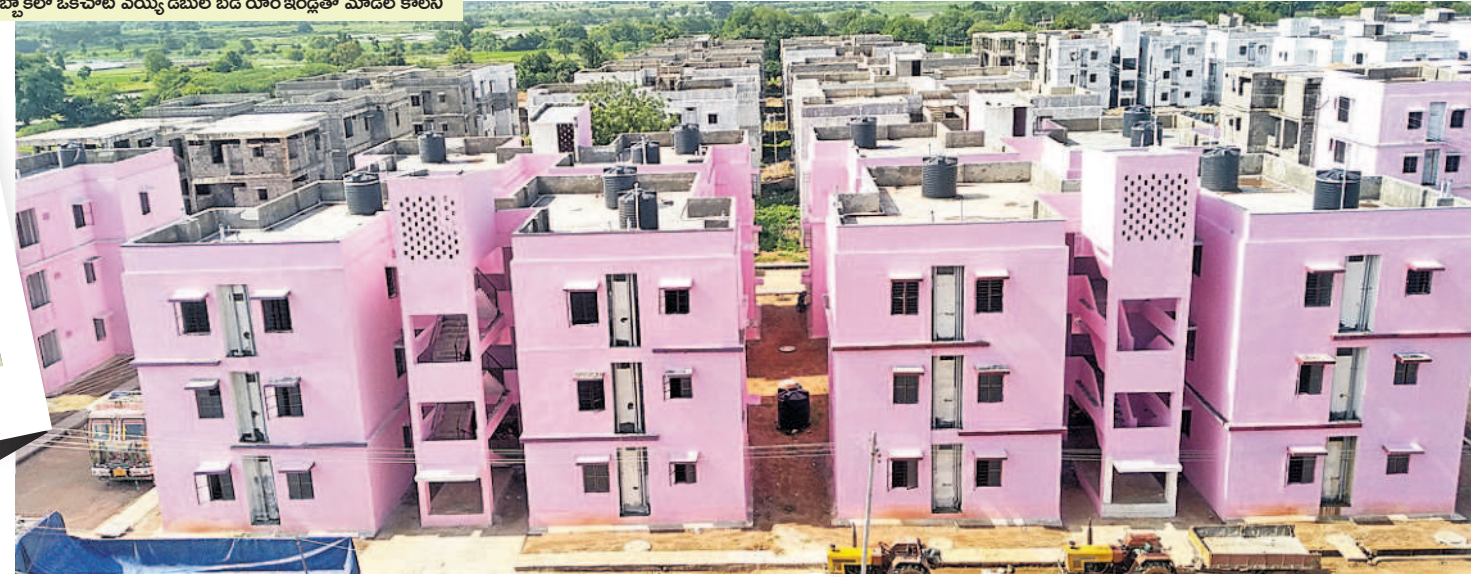
దుబ్బాకలో ఒకేచోట మొత్తం డబుల్ బెడ్ రూం ఇండ్లతో మోడల్ కాలనీ