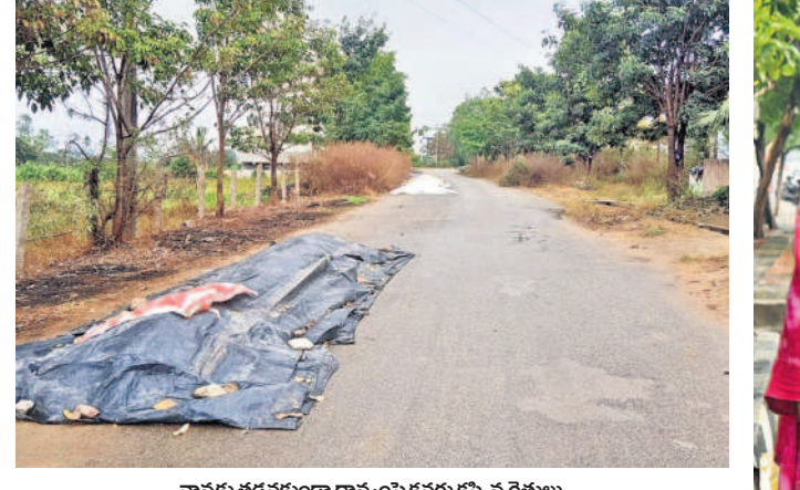
వానకు తడవకుండా ధాన్యంపై కవచం కప్పిన రైతులు

సిద్దిపేట అర్బన్, డిసెంబర్ 5 : సిద్దిపేట జిల్లాలో ఒక్కసారిగా వాతావరణ మారింది. తుఫాన్ ప్రభావంతో జిల్లాలోని పలు ప్రాంతాల్లో చిరు జల్లులతో కూడిన వర్షం కురిసింది. ఓ వైపు చలితో ఇబ్బంది పడుతున్న ప్రజలకు.. తుఫాన్ కారణంగా చలి తీవ్రత మరింత ఎక్కువైంది. చలి తీవ్రతతో ప్రజలెవరూ బయటకు ఎక్కువగా రావడం లేదు. పసుల కోసం బయటకు వెళ్లే వారు స్వల్పంగా, ముక్కి క్యాపులు ధరిస్తున్నారు. మంగళవారం ఉదయం నుంచే ఓ మోస్తరు వర్షం కురిసింది. కొన్ని ప్రాంతాల్లో ఓ మోస్తరు వర్షం పడటంతో పాటు చిరుజల్లులు వడ్డాయి. జిల్లా వ్యాప్తంగా రెండు రోజుల పాటు ఓ మోస్తరు వర్షం కురిసింది. అత్యవసర ప్రయోజనాలు తప్పే ఎక్కువ శాతం ప్రజలు ఇండ్లకే పరిమితమయ్యారు. మండలంలోని చాలా గ్రామాల్లో రోడ్లపైనే ఆరబెట్టిన ధాన్యంపై కవచం (పాలిథిన్) కప్పి ఉంచారు.