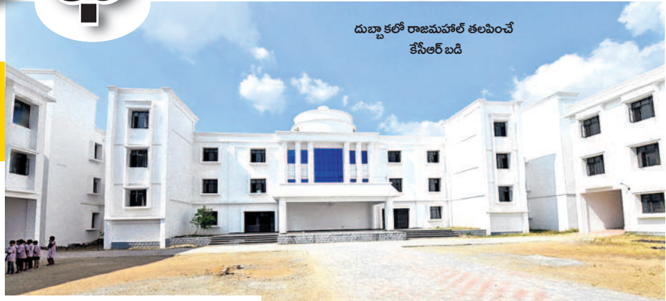
దుబ్బాకలో రాజసింహుల కేంద్రం