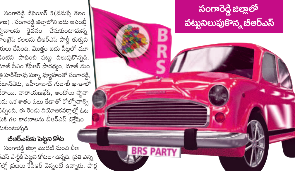
సంగారెడ్డి జిల్లాలో పట్టునిలుపుకొన్న బీఆర్ఎస్