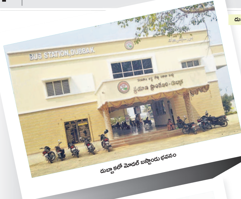
దుబ్బాకలో మోడల్ బస్స్టాండు భవనం