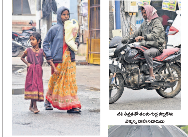
చలి తీవ్రతతో తలకు గుడ్ల కట్టుకొని వెళ్తున్న వాననదారుడు