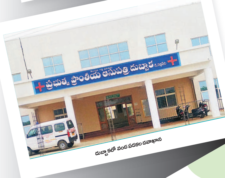
దుబ్బాకలో వంద పడకల దవాఖానం