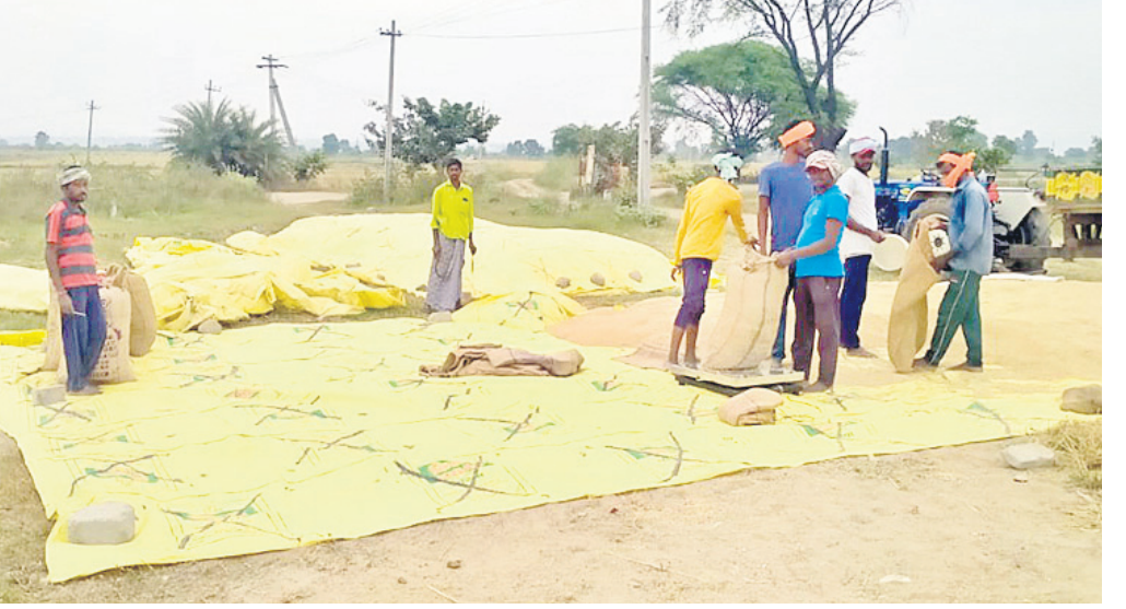
దహంగాలో వ్యవసాయ కేంద్రాల్లో వరి ధాన్యం కొనుగోలు చేస్తున్న వ్యాపారులు

జిల్లాలో ఈ ఏడాది ఎన్నికల కారణంగా ప్రభుత్వ వరి ధాన్యం కొనుగోలు కేంద్రాలు ఇంకా జిల్లాలో ప్రారంభించలేదు. దీంతో ప్రైవేటు వ్యాపారులు వరి కల్లాల్లోనే తాత్కాలిక కొనుగోలు కేంద్రాలు ఏర్పాటు చేసి ధాన్యం కొంటున్నారు. క్వింటాలుకు రూ. 1900 నుంచి రూ. 2వేల వరకు చెల్లిస్తున్నారు. ఎఫ్సీఐ ద్వారా జిల్లాలో ఇంకా ధాన్యం కొనుగోలు కేంద్రాలు ప్రారంభం కాకపోవడంతో, వ్యాపారులే రంగంలోనికి దిగి ధాన్యాన్ని కొనుగోలు చేస్తున్నారు. జిల్లాలో గత ఐదేళ్ల కాలంలో సాగు విస్తీర్ణం భారీ స్థాయిలో పెరిగింది. ప్రస్తుతం జిల్లాలో సాగు 4.85 వేల ఎకరాల్లో సాగు అవుతున్నది. ఐదేళ్ల కాలంలో దాదాపు 1 లక్షా 10 వేల ఎకరాల్లో సాగు పెరిగింది. ఉచిత విద్యుత్, రైతులకు బోర్ల ద్వారా సాగునీరు పుష్కలంగా తగ్గినప్పటికీ, సుమారు 10 నుంచి 12 లక్షల క్వింటాళ్ల దిగుబడి వస్తుందని అధికారులు అంచనా వేస్తున్నారు.