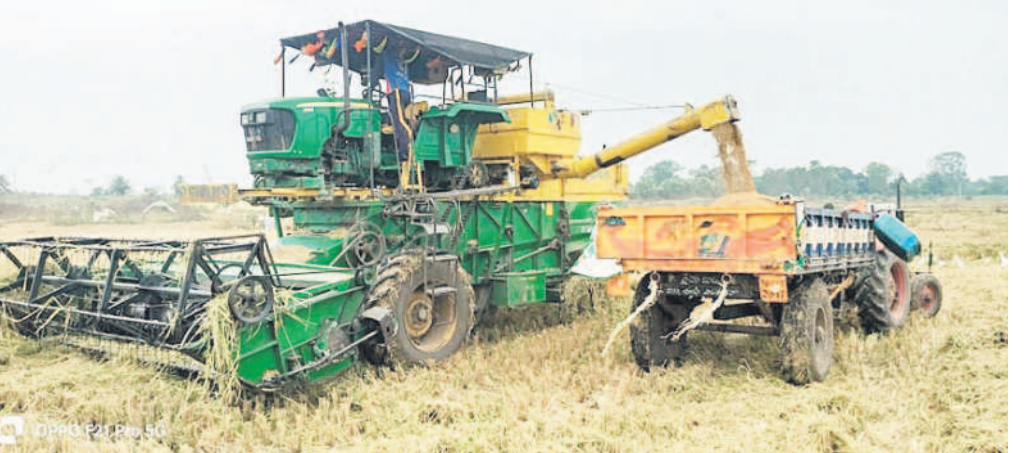
ఆసిఫాబాద్ జిల్లాలో యంత్రాలతో జోరుగా సాగుతున్న వరికోతలు