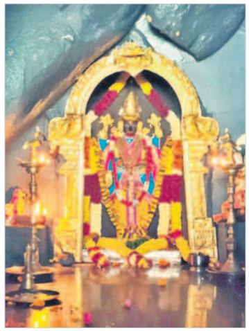
కాంచన గుహలో కొలువుదీరిన స్వామి వారు

దేవరకల్ల రూరల్ (చిన్నచింతకుంట), డిసెంబర్ 5 : ఉమ్మడి పాలమూరు జిల్లాలోని చిన్నచింతకుంట మండలం లోని అమ్మవూర్ గ్రామ సమీపంలోని సప్త గిరులోని కాంచన గుహలో కొలువు తీరిన కురుమూర్తి స్వామి జాతర వేడుకలు కొనసాగుతున్నాయి. ఆలయ అర్చకులు మంగళవారం స్వామివారికి నిత్యపూజలు నిర్వహించారు. భక్తులు ఆలయ ప్రాంగణంలోని పుష్పరిణిలో పుణ్యస్నానాలు ఆచరించి, కొత్త కుండల్లో పచ్చిపులుసు అన్నం, పాయసం తయారు చేసి నైవేద్యాలు సమర్పించి మొక్కులు చెల్లించుకున్నారు. జాతర లో ఉన్న మిఠాయి దుకాణాల్లో మిఠాయిలు, చిన్న పిల్లల ఆటవస్తువులు కొనుగోలు చేయడంతో ప్రాంగణమంతా సందడి వాతావరణం నెలకొన్నది.