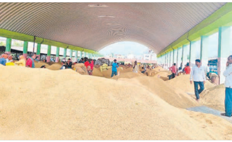
బాదేపల్లి వ్యవసాయ మార్కెట్ కు అమ్మకానికి వచ్చిన ధాన్యం

జడ్పీ, డిసెంబర్ 5 : బాదేపల్లి వ్యవసాయ మార్కెట్ యార్డుకు మంగళవారం ధాన్యం పోటిత్తింది. మిగ్ జాం తుషాన్ కారణంగా వర్షాలు కురిసి అవకాశం ఉందని వాతావరణశాఖ హెచ్చరించడంతో రైతులు తమ దగ్గర ఉన్న ధాన్యాన్ని మార్కెట్ కు తరలించడంతో మార్కెట్ లో పెద్దఎత్తున ధాన్యరాశులు పోశారు. పెద్దమొత్తంలో 92వేల బస్తాలు అమ్మకానికి