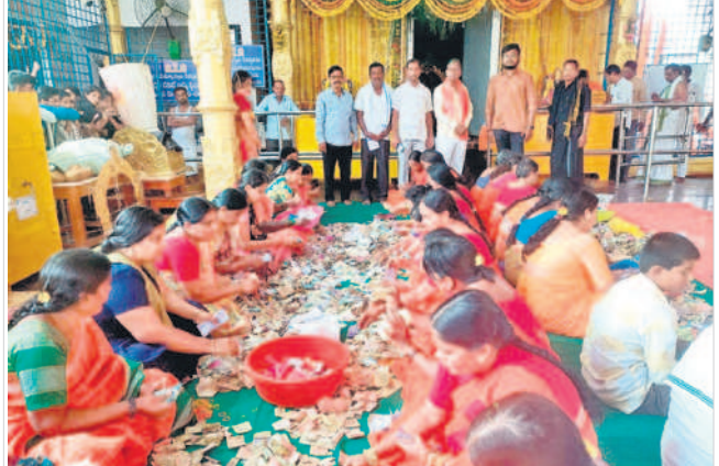
హుండీ లెక్కింపు సందర్భంగా, భక్తులు