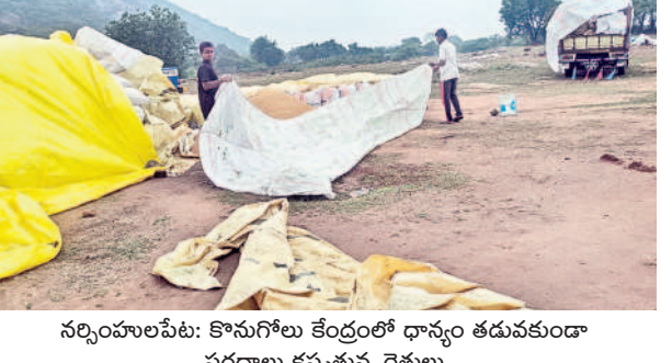
నర్సంపాలపేట: కొనుగోలు కేంద్రంలో ధాన్యం తడువకుండా పరదాలు కప్పిస్తున్న రైతులు