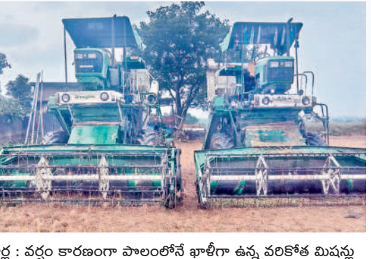
గార్ల : వర్షం కారణంగా పాలంలోనే ఖాళీగా ఉన్న వరికోత మిషన్లు