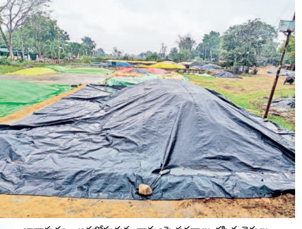
ఖానాపూరు : ఆరబోతున్న ధాన్యంపై పరదాలు కప్పిన రైతులు