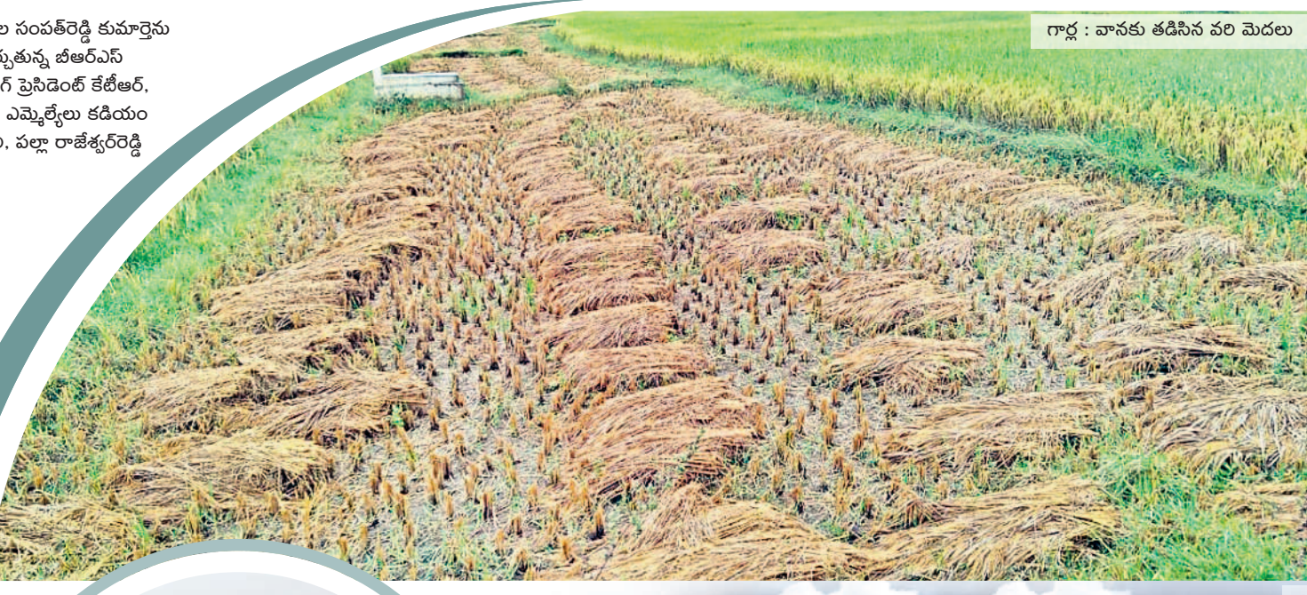
గార్ల : వానకు తడిసిన వరి మెదలు