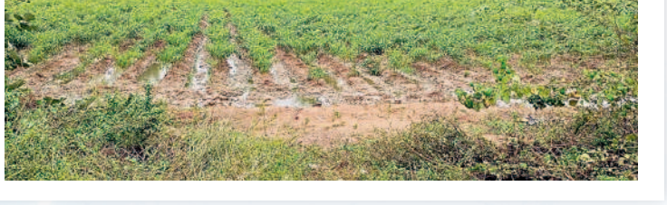
కాటారం : శంకరంపల్లిలో..