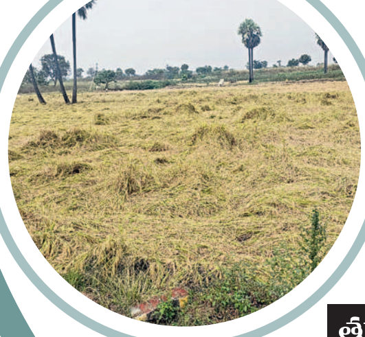
అత్తకూరు : హొబులుబాగుల్లో నేలవాలిన వరి