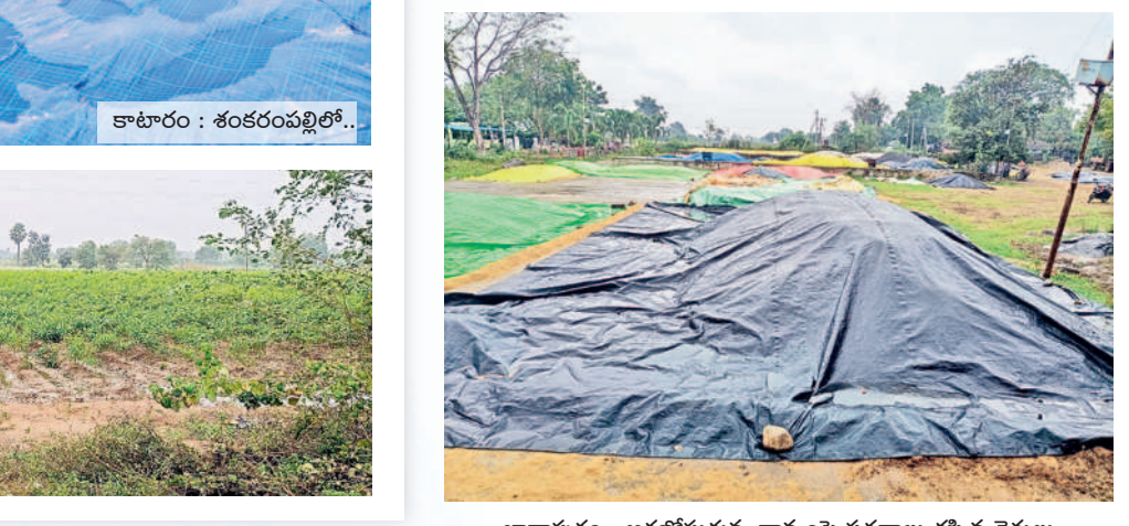
ఖానాపూరు : ఆరబోసుకున్న ధాన్యంపై పరదాలు కప్పిన రైతులు