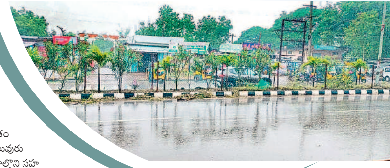
ములుగులో కురుస్తున్న వర్షం