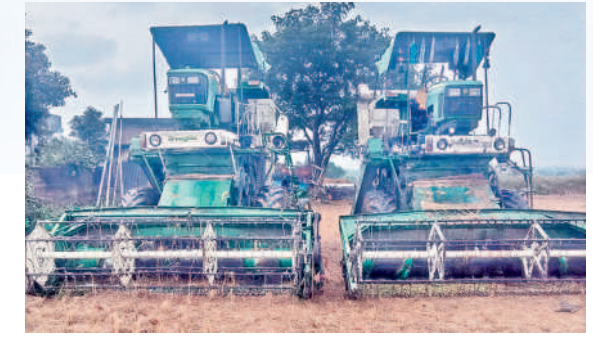
గార్ల : వర్షం కారణంగా పొలంలోనే ఖాళీగా ఉన్న వరికోత మిషన్లు