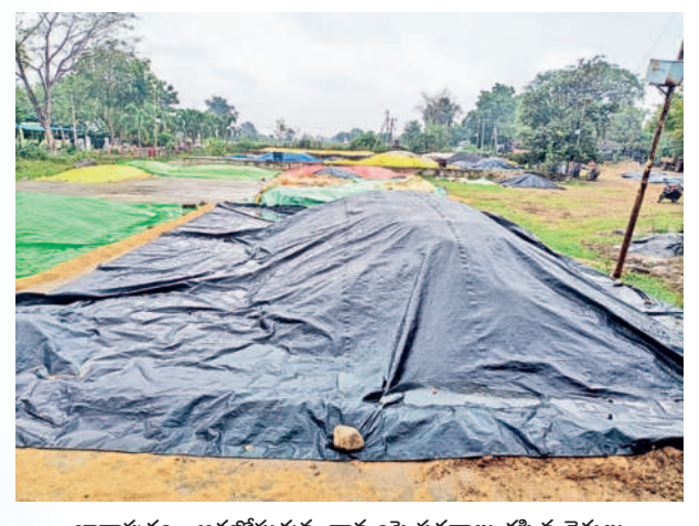
ఖానాపూరు : ఆరబోసుకున్న ధాన్యంపై పరదాలు కప్పిన రైతులు