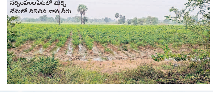
నర్సంపాలపేటలో మిర్చి చేసులో నిలిచిన వాన నీరు