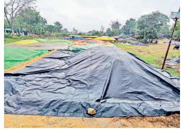
ఖానాపూరు : ఆరబోతున్న ధాన్యంపై పరదాలు కప్పిన రైతులు