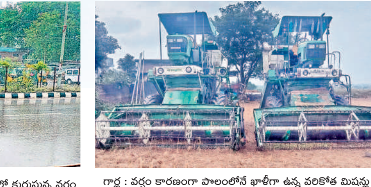
గార్ల : వర్షం కారణంగా పొలంలోనే ఖాళీగా ఉన్న వరికోత మిషన్లు