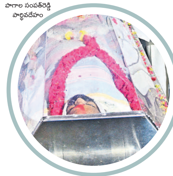
పాగాల సంపత్ రెడ్డి పార్లమెంటుపై