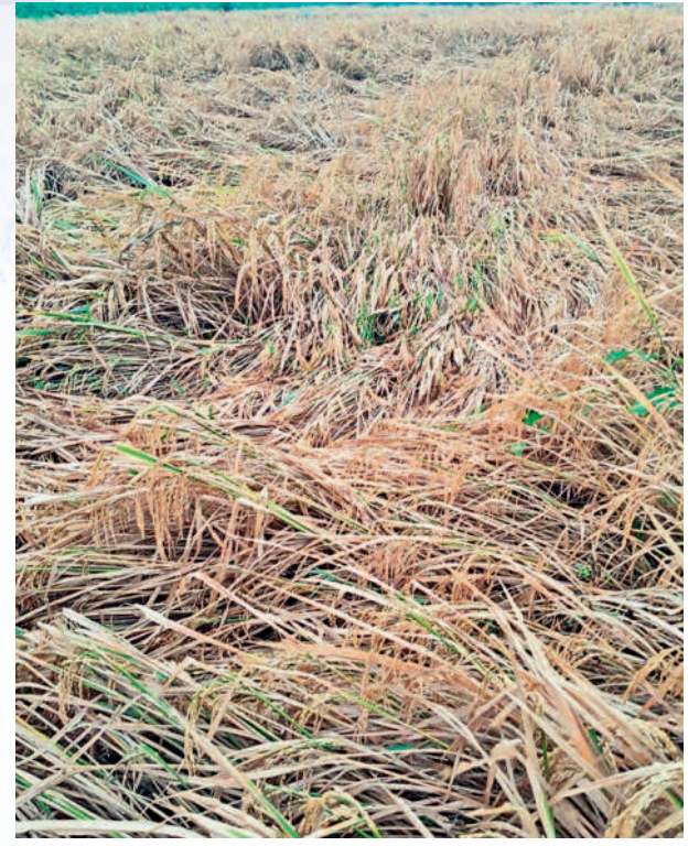
కాయంపేట : సూరంపేటలో నేలవాలిన వరి