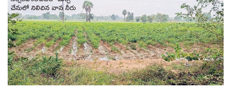
కాటారం : శంకరంపల్లిలో..