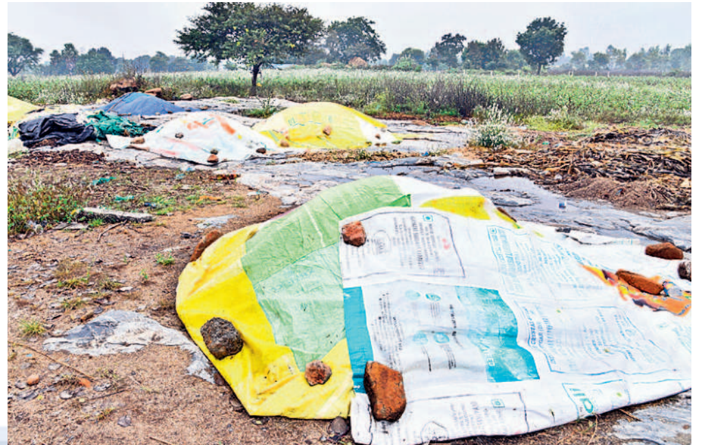
బిల్వూర్ మండలం రాజవరంలో వడ్డపై పరదాలు కప్పిన రైతులు