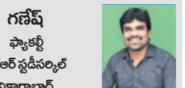
గణేష్ ష్యాక్లి ఏకేఆర్ స్టడీసర్కిల్ వికారాబాద్