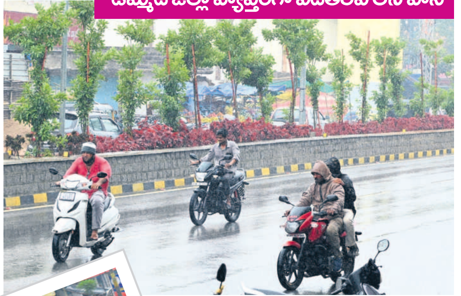
నల్లగొండ జిల్లా కేంద్రంలో కురుస్తున్న చిరుజల్లులు

ఉమ్మడి జిల్లా వ్యాప్తంగా ఎడతెరిపి లేని వాన