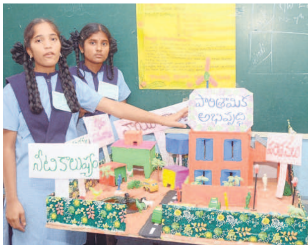
సైన్స్ ఫెయిర్లో ఎగ్జిబిట్ ప్రదర్శిస్తున్న విద్యార్థినులు (ఫైర్)