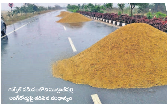
గజ్వేల్ సమీపంలోని ముట్లాజేపల్లి రింగ్ రోడ్డుపై తడిసిన వరిధాన్యం

బంగాళాఖాతంలో ఏర్పడిన తుఫాన్ ప్రభావం ఉమ్మడి మెదక్ జిల్లాపై పడింది. ఒక్కసారిగా వాతావరణం మారింది. చలి తీవ్రతతో ప్రజలెవరూ ఎక్కువగా బయటకు రావడం లేదు. పనుల కోసం వచ్చేవారు స్వీటర్లు, మంకీ క్యాపులు ధరిస్తున్నారు. మంగళవారం ఉదయం నుంచే కొన్ని ప్రాంతాల్లో చిరుజల్లులు, మరికొన్ని ప్రాంతాల్లో మోస్తరు వర్షం కురిసింది. రెండు రోజుల పాటు ఓ మోస్తరు నుంచి భారీ వర్షాలు కురిసి అవకాశం ఉందని వాతావరణశాఖ హెచ్చరికలు జారీ చేసింది. దీంతో అధికారులు అప్రమత్తమయ్యారు. - సిద్దిపేట అర్బన్, డిసెంబర్ 5