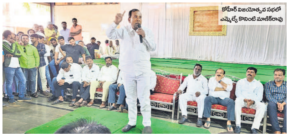
కోహీర్ విజయోత్సవ సభలో ఎమ్మెల్యే కొనింటి మాణిక్రావు