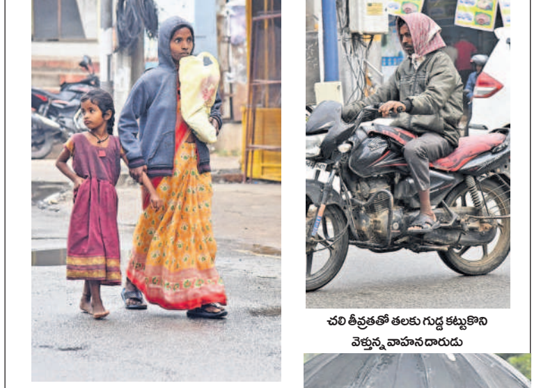
చలి తీవ్రతతో తలకు గుడ్ల కట్టుకొని వెళ్తున్న వాననదారుడు