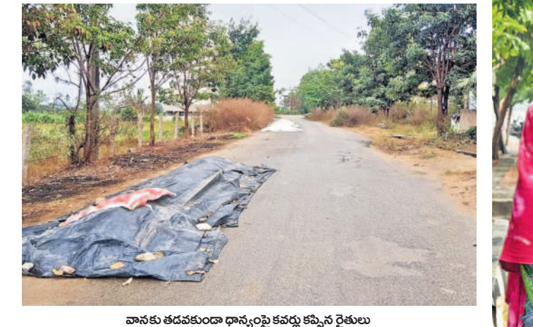
వానకు తడవకుండా ధాన్యంపై కవచం కప్పిన రైతులు

సిద్దిపేట అర్బన్, డిసెంబర్ 5 : సిద్దిపేట జిల్లాలో ఒక్కసారిగా వాతావరణ మారింది. తుఫాన్ ప్రభావంతో జిల్లాలోని పలు ప్రాంతాల్లో చిరు జల్లులతో కూడిన వర్షం కురిసింది. ఓ వైపు చలితో ఇబ్బంది పడుతున్న ప్రజలకు.. తుఫాన్ కారణంగా చలి తీవ్రత మరింత ఎక్కువైంది. చలి తీవ్రతతో ప్రజలెవరూ బయటకు ఎక్కువగా రావడం లేదు. పసుల కోసం బయటకు వెళ్లే వారు స్వల్పంగా, ముక్కి క్యాపులు ధరిస్తున్నారు. మంగళవారం ఉదయం నుంచే ఓ మోస్తరు వర్షం కురిసింది. కొన్ని ప్రాంతాల్లో ఓ మోస్తరు వర్షం పడటంతో పాటు చిరుజల్లులు వడ్డాయి. జిల్లా వ్యాప్తంగా రెండు రోజుల పాటు ఓ మోస్తరు వర్షం కురిసింది. అత్యవసర ప్రయోజనాలు తప్పే ఎక్కువ శాతం ప్రజలు ఇండ్లకే పరిమితమయ్యారు. మండలంలోని చాలా గ్రామాల్లో రోడ్లపైనే ఆరబెట్టిన ధాన్యంపై కవచం (పాలిథిన్) కప్పి ఉంచారు.