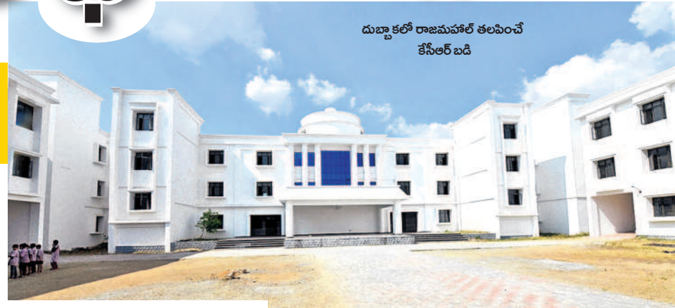
దుబ్బాకలో రాజసింహుల తలపించే కేసీఆర్ బడి