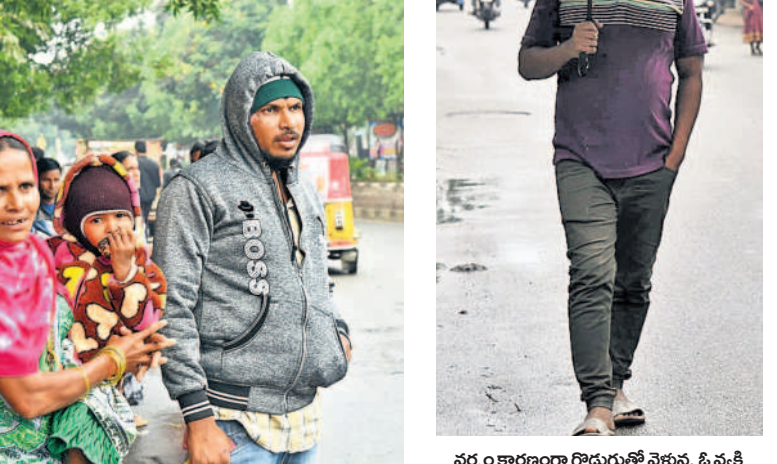
వర్షం కారణంగా గొడుగుల్లో వెళ్తున్న ఓ వ్యక్తి