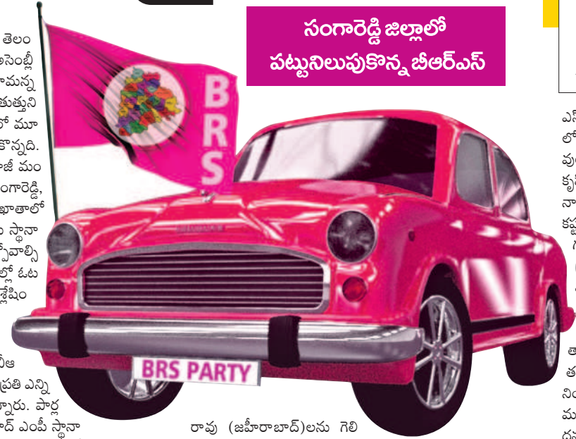
సంగారెడ్డి జిల్లాలో పట్టునిలుపుకొన్న బీఆర్ఎస్

సంగారెడ్డి డిసెంబర్ 5(నమస్తే తెలంగాణ) : సంగారెడ్డి జిల్లాలోని ఐదు అసెంబ్లీ స్థానాలను కైవసం చేసుకుంటూ మున్సిపల్ కాంగ్రెస్ కలలను బీఆర్ఎస్ పార్టీ తుక్కుని యలు చేసింది. మొత్తం ఐదు సీట్లలో మూడింటిని సాధించి పట్టు నిలుపుకొన్నది. మాజీ సీఎం కేసీఆర్ సారథ్యం, మాజీ మంత్రి హరీరావు పక్కా పూర్వహితం సంగారెడ్డి పటానించారు. జహీరాబాద్ గులాబీ ఖాతాలో చేరాయి. నారాయణపేట, అందోలు స్థానాలను ఒక శాతం ఓటు తేడాతో కోల్పోవాల్సి వచ్చింది. ఈ రెండు నియోజకవర్గాల్లో ఓటు మికి గల కారణాలను బీఆర్ఎస్ విశ్లేషించుకుంటున్నది.